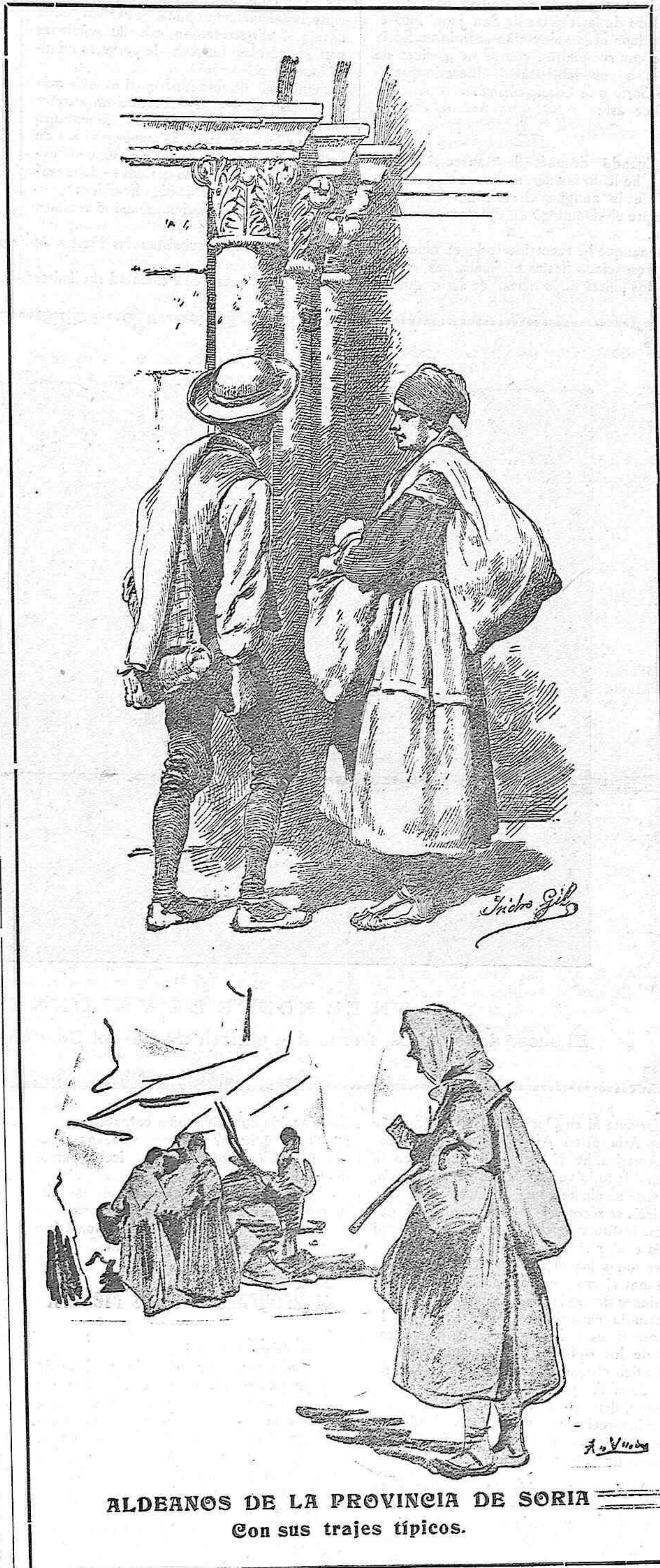
ALDEANOS DE LA PROVINCIA DE SORIA Con sus trajes típicos.

Noticiero de Soria les tributa esta Página, muy identificada con el país, que sufre, que trabaja y que si bien