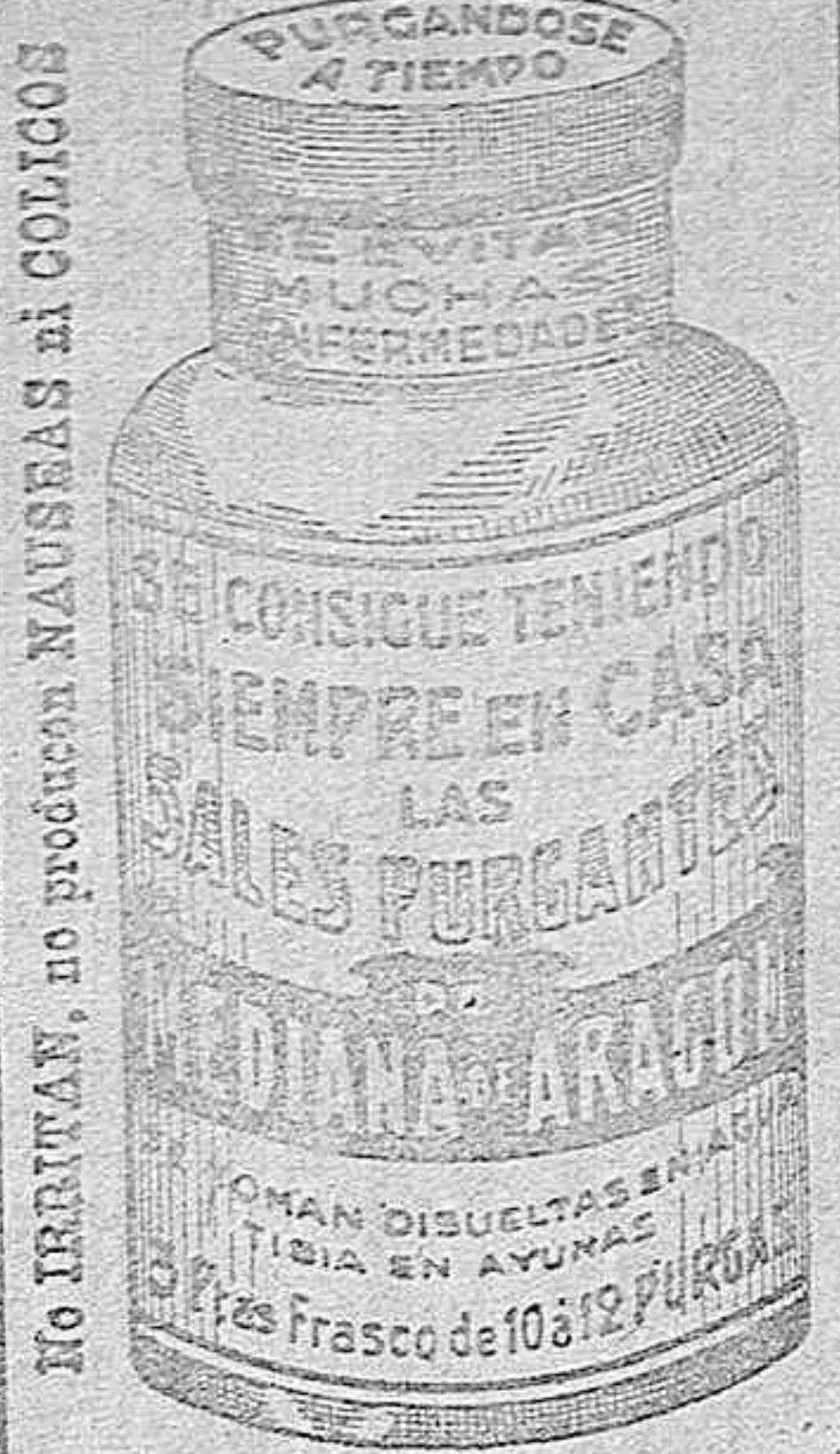
NO IRRITAN, no producen NAUSEAS ni COLICOS