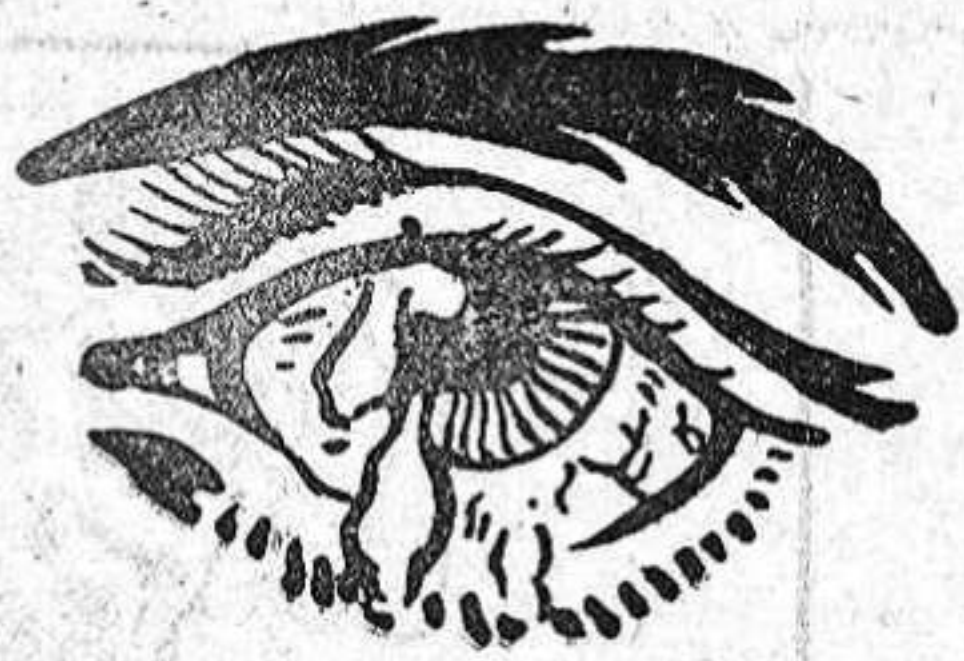
SALVE VD. SUS OJOS

En nuestra felicitación, incluimos a todos los queridos compañeros que forman la redacción del colega.