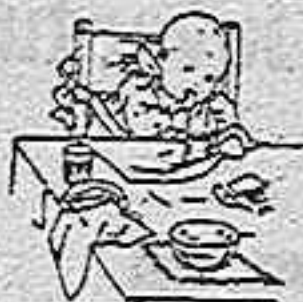
En el Riquitismo

Produce este ELIXIR efectos admirables. Los dolores profundos de cabeza, fatiga, insomnio, dolores medulares, desarreglos gástricos y demás padecimientos que consumen poco a poco al enfermo y terminan en el abatimiento, impotencia y postración general, desaparecen al poco tiempo con el uso de este específico, notándose ya desde las primeras tomas un aumento de fuerza y de agilidad que ponen rápidamente al enfermo en estado de completa curación.