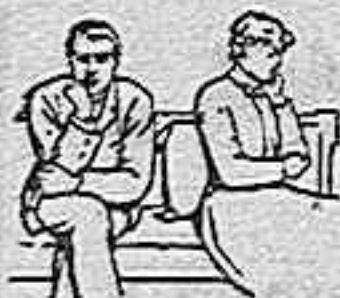
En la Neurastenia

Produce este ELIXIR efectos admirables. Los dolores profundos de cabeza, fatiga, insomnio, dolores medulares, desarreglos gástricos y demás padecimientos que consumen poco a poco al enfermo y terminan en el abatimiento, impotencia y postración general, desaparecen al poco tiempo con el uso de este específico, notándose ya desde las primeras tomas un aumento de fuerza y de agilidad que ponen rápidamente al enfermo en estado de completa curación.