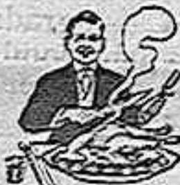
En la Dispepsia

Recobra poco a poco el rostro su color natural, desaparece la melancolía tan propia de esta enfermedad, cálmense los dolores, de las menstruaciones, regularizándose éstas periódicamente y se modifica de tal modo el estado general de la enferma, que de taciturna y triste tórnase alegre y lozana.