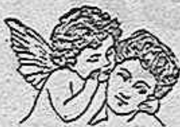
En la Anemia y Clorosis

DOSIS: (Una cucharadita de café al principio de cada comida). Su sabor agradable le hace preferible al aceite de hígado de bacalao al que substituye con ventaja.