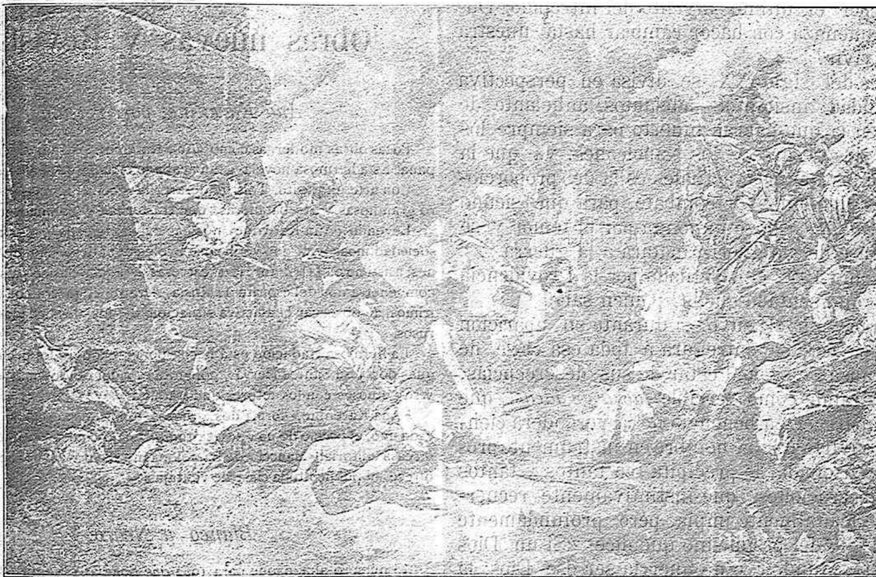
CUADRO del insigne pintor español don Alejo Vera, que fué premiado en la Exposición de Bellas Artes de Madrid en 1881, adquiriéndose después tan valiosa joya por el Estado.

que será, y en melancólico desdén caen precipitadamente con la fuerza impulsora de lo que estorba, las últimas hojas de su calendario, que tambaleándose por los últimos arrestos de su existencia, se extienden desdeñosamente al suelo al sonar la última campanada del 31 de Diciembre, para en el amalgamarse, y ser pisoteadas con la indiferencia de lo que ya no existe.