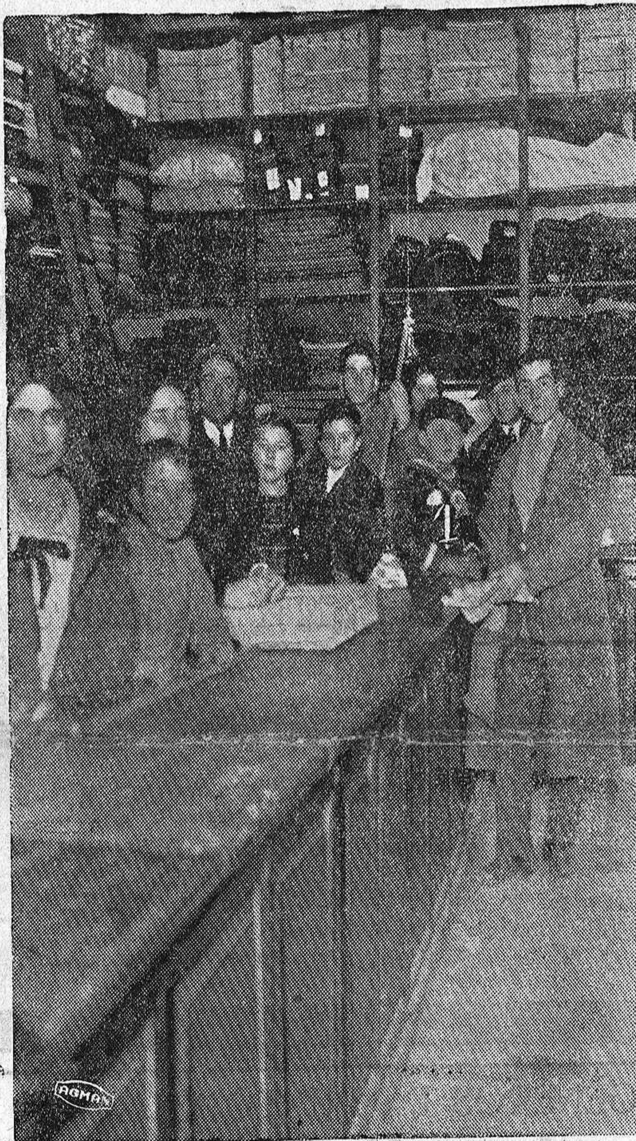
Un hermoso niño, equipado de pies a cabeza por obra y milagro de los Reyes Magos que dejaron el equipo en el comercio «El Iris».