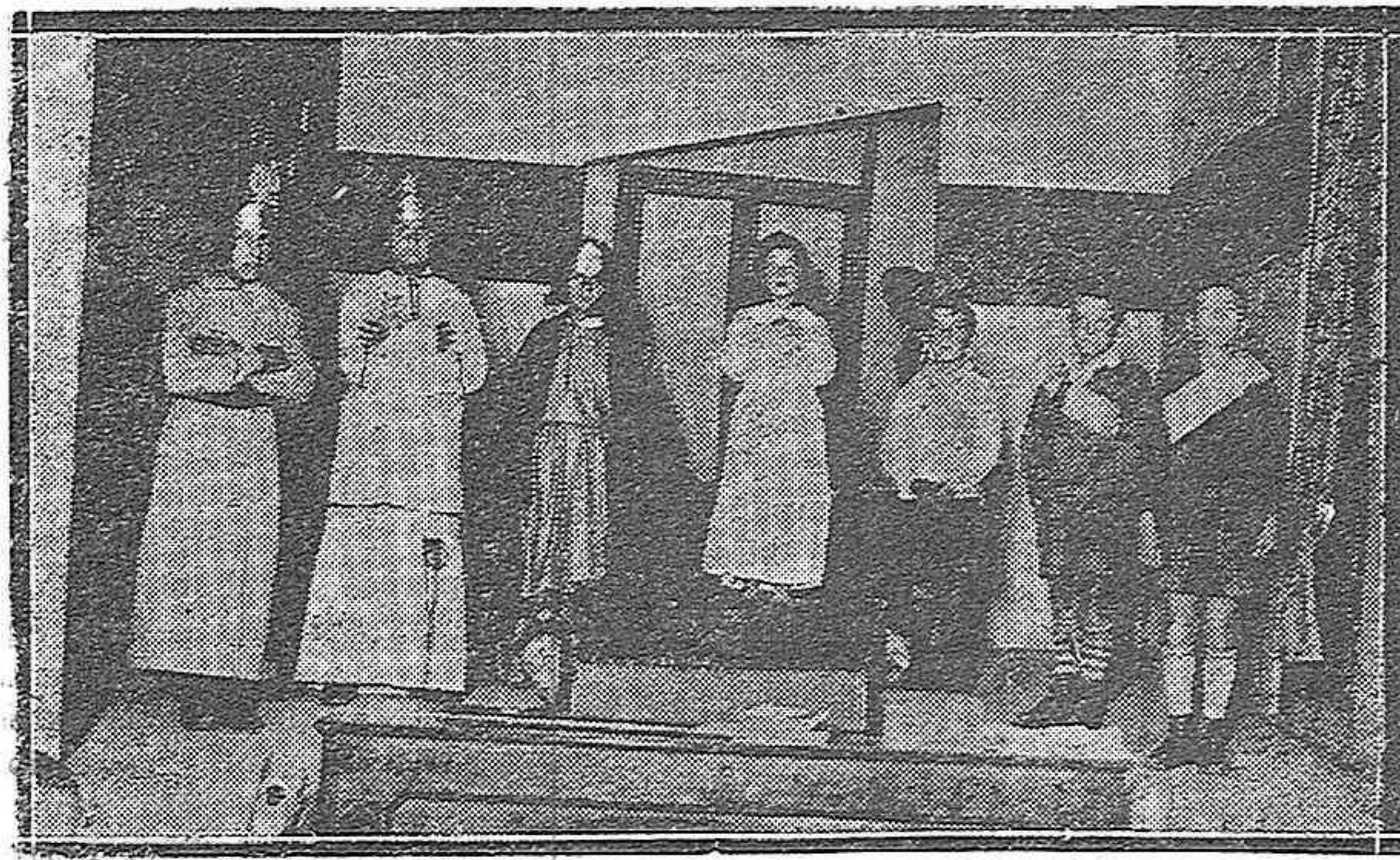
LA FIESTA CELEBRADA EN LOS SINDICATOS CATOLICOS. Los niños de las escuelas populares, que en los Sindicatos Católicos de Obreros de Palencia regentan los beneméritos HH. de las EE. Cristianas, celebraron el pasado domingo una fiesta, con amena velada teatral. He aquí una interesante escena de las obras representadas por los simpáticos escolares