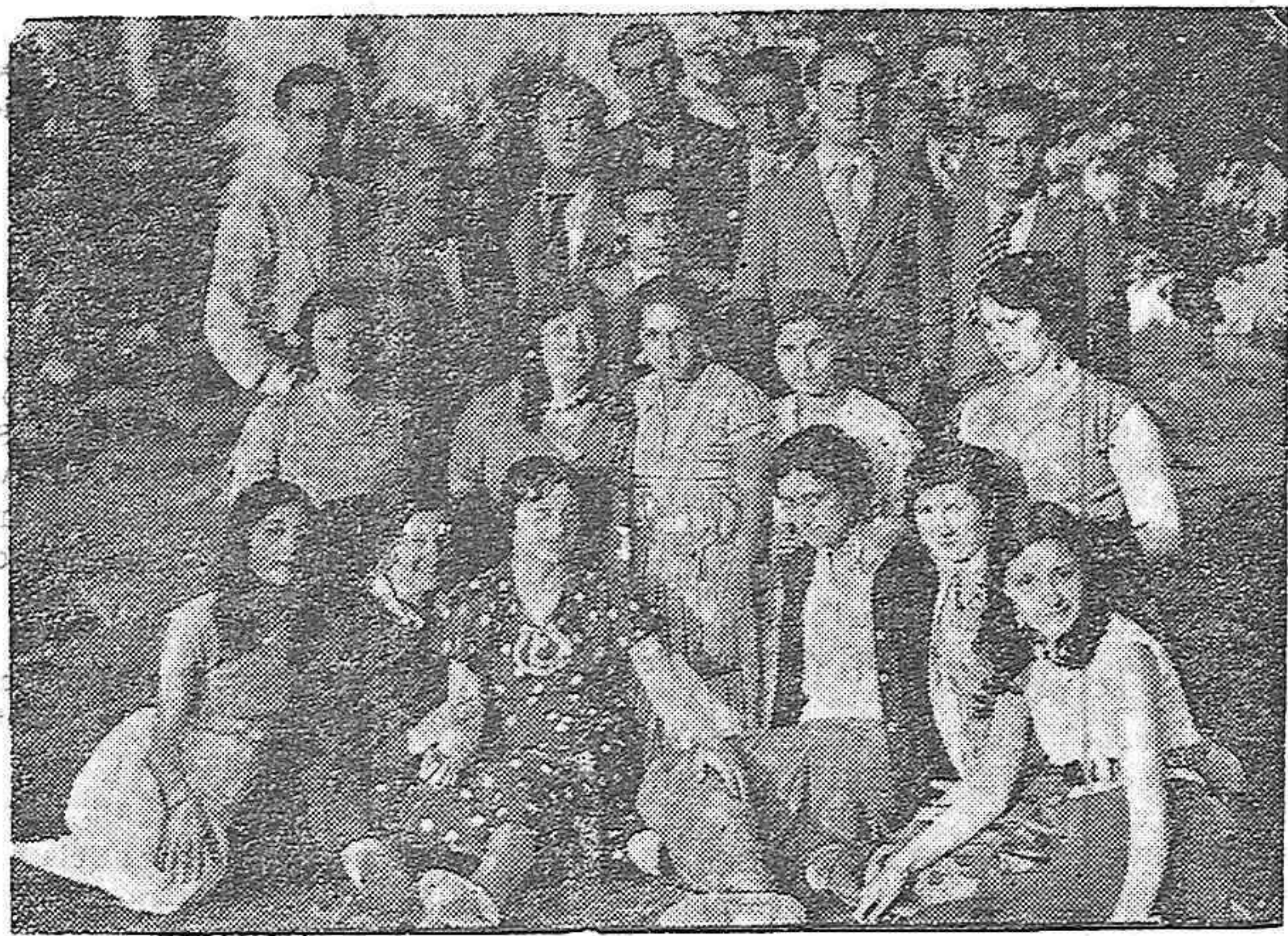
"EL DIA DE PALENCIA" EN LA VILLA DE OSORNO. Nuestro fotógrafo ha sorprendido, a su paso por Osorno, este simpático grupo, en el que tanto destaca la belleza de las señoritas osornenses, a quienes hacen coro un "pelotón" de galanes

Así hablan los hombres que no se ponen de espaldas a la luz.