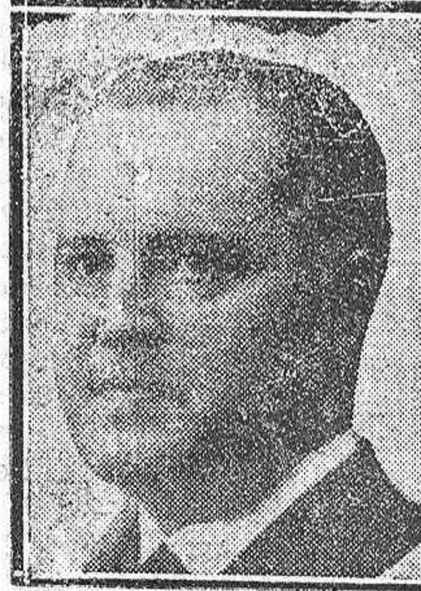
D. Angel Galarza y Gago, fiscal general de la República