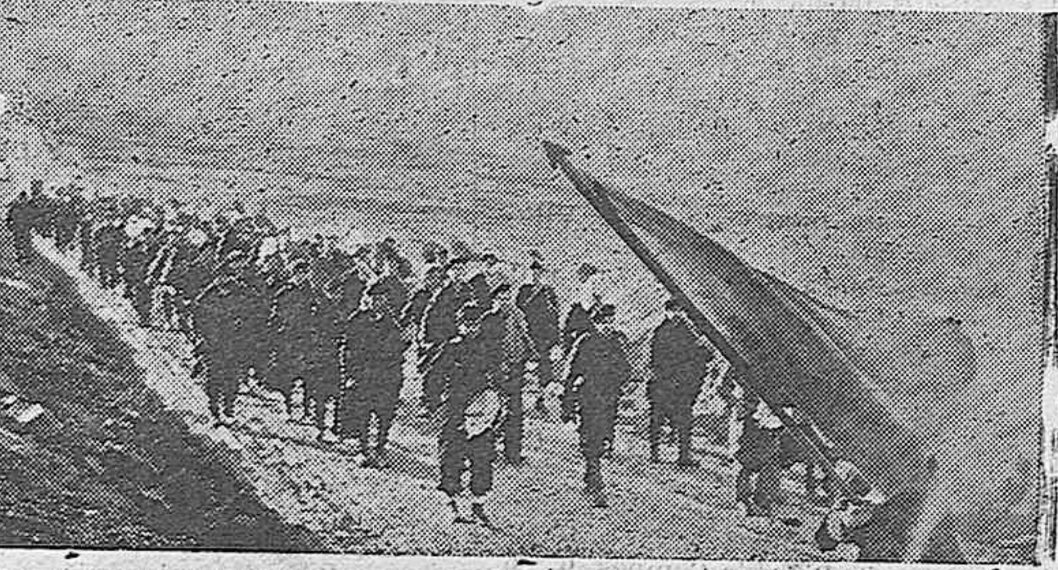
LA SEGUNDA LINEA DE F. E. T. Y DE LAS J. O. N.-S. REGRESA DESPUES DE UNO DE LOS DIAS DEDICADOS A LA REPOBLACION FORESTAL (Información en cuarta plana)