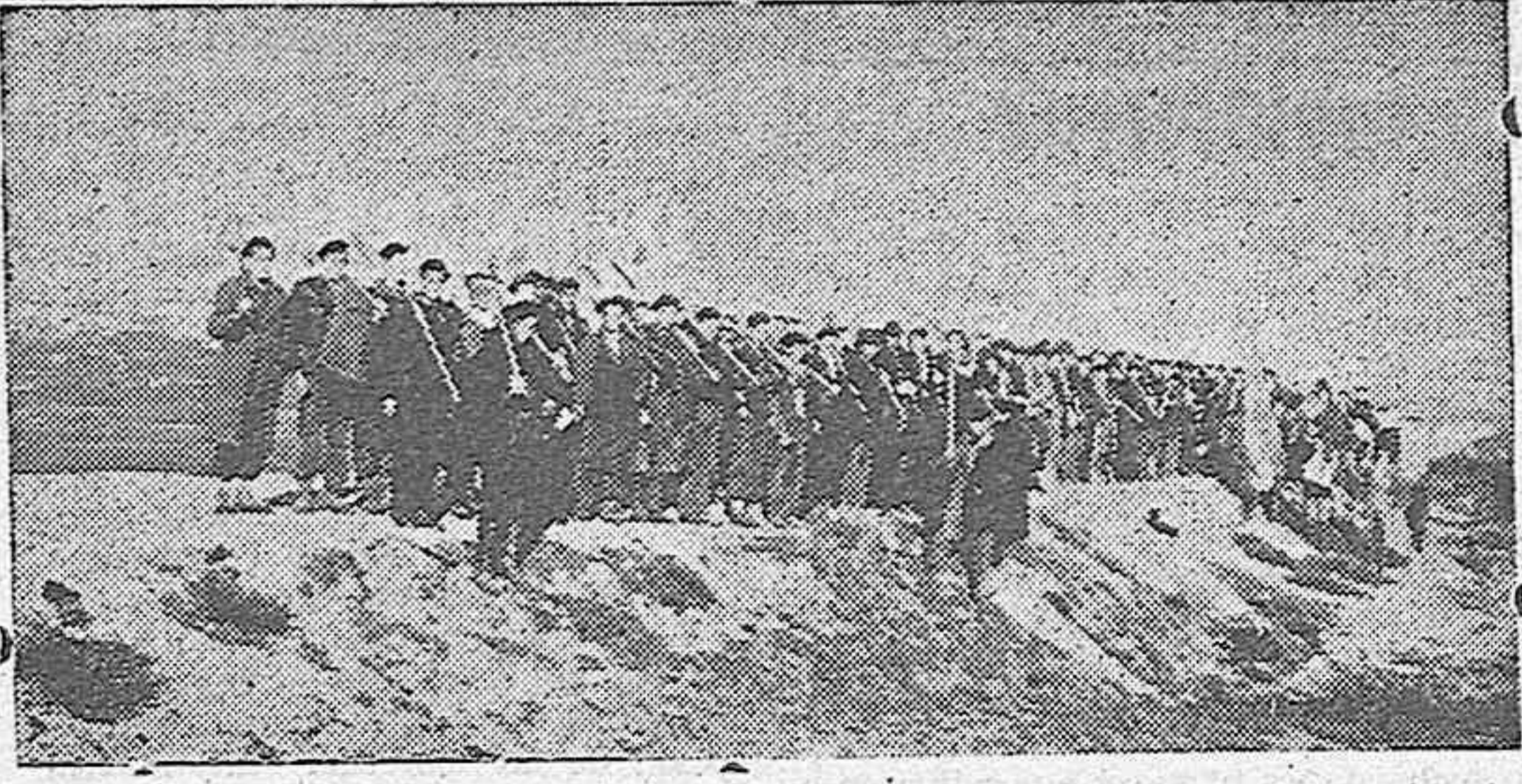
El fotógrafo sorprende a esta brigada de trabajadores de F. E. T. y de las Jons, momentos antes de comenzar la repoblación forestal.

Cuando aquellos días fríos de diciembre y enero, con nieve y agua, veía la población salir por las calles de la ciudad con dirección al campo a aquellas brigadas de trabajadores de F. E. T. y de las Jons, yo sé que no faltaba quien lo ridiculizaba y otros que les trataban de locos. Pero las camisetas azules que sabían que cientos, miles de camaradas, salían diariamente a prestar servicios en el campo luchando con las inclemencias del tiempo, quisieron imitarlos y allá se fueron también, no a exhibirse como otros creían, que ello está muy lejos de la Organización. Y para que el lector pueda darse una idea del trabajo realizado en pro de la repoblación forestal, a continuación publicamos ligera estadística del resultado de aquel esfuerzo: