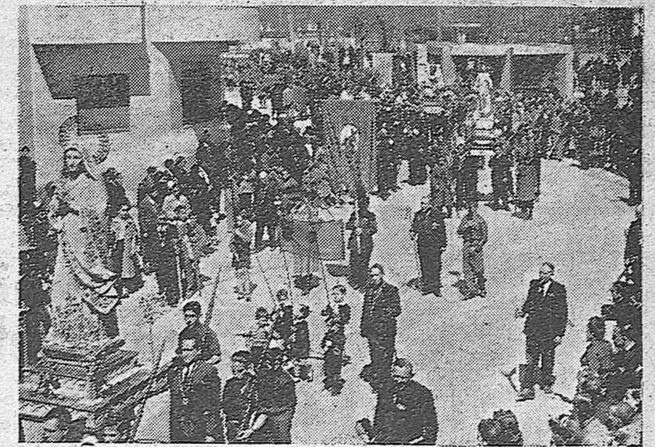
DOS ASPECTOS DE LA PROCESION DEL SEÑOR RESUCITADO QUE SE CELEBRO EN PALENCIA EL DOMINGO CON SU TRADICIONAL BRILLANTEZ