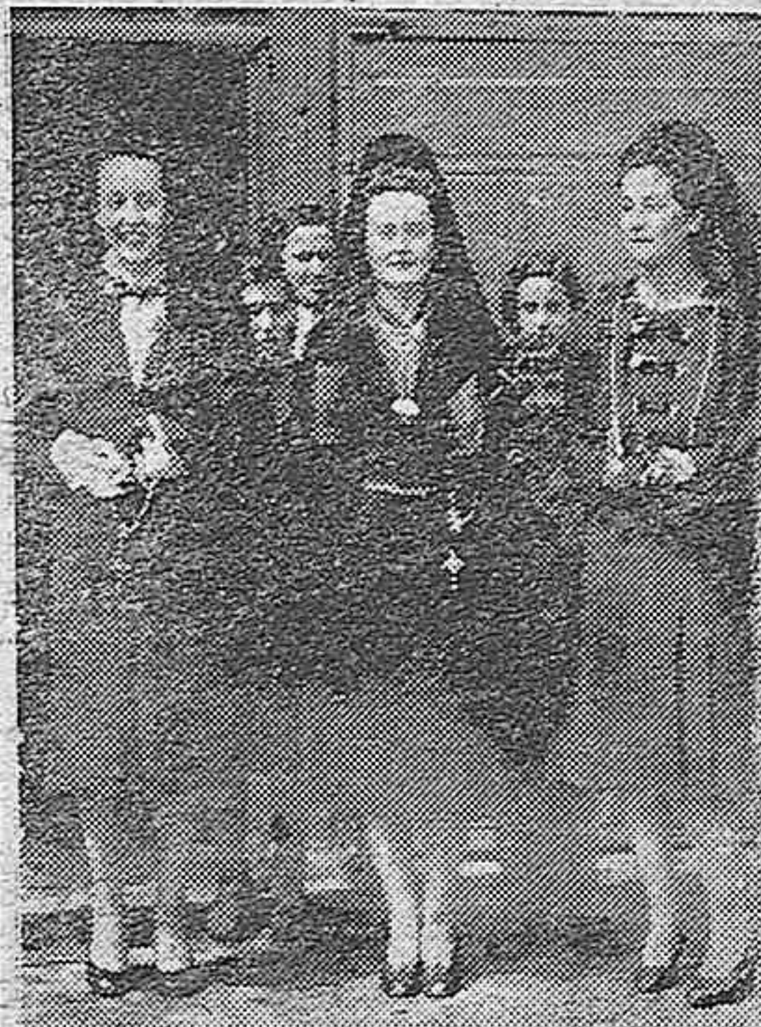
DURANTE LA PASADA SEMANA SANTA GENTILES SEÑORITAS DE NUESTRA CIUDAD VISTIERON LA ELEGANTE Y ESPANOLISIMA MANTILLA. UN GRUPO DE ESTAS AL SALIR DE LA CATEDRAL