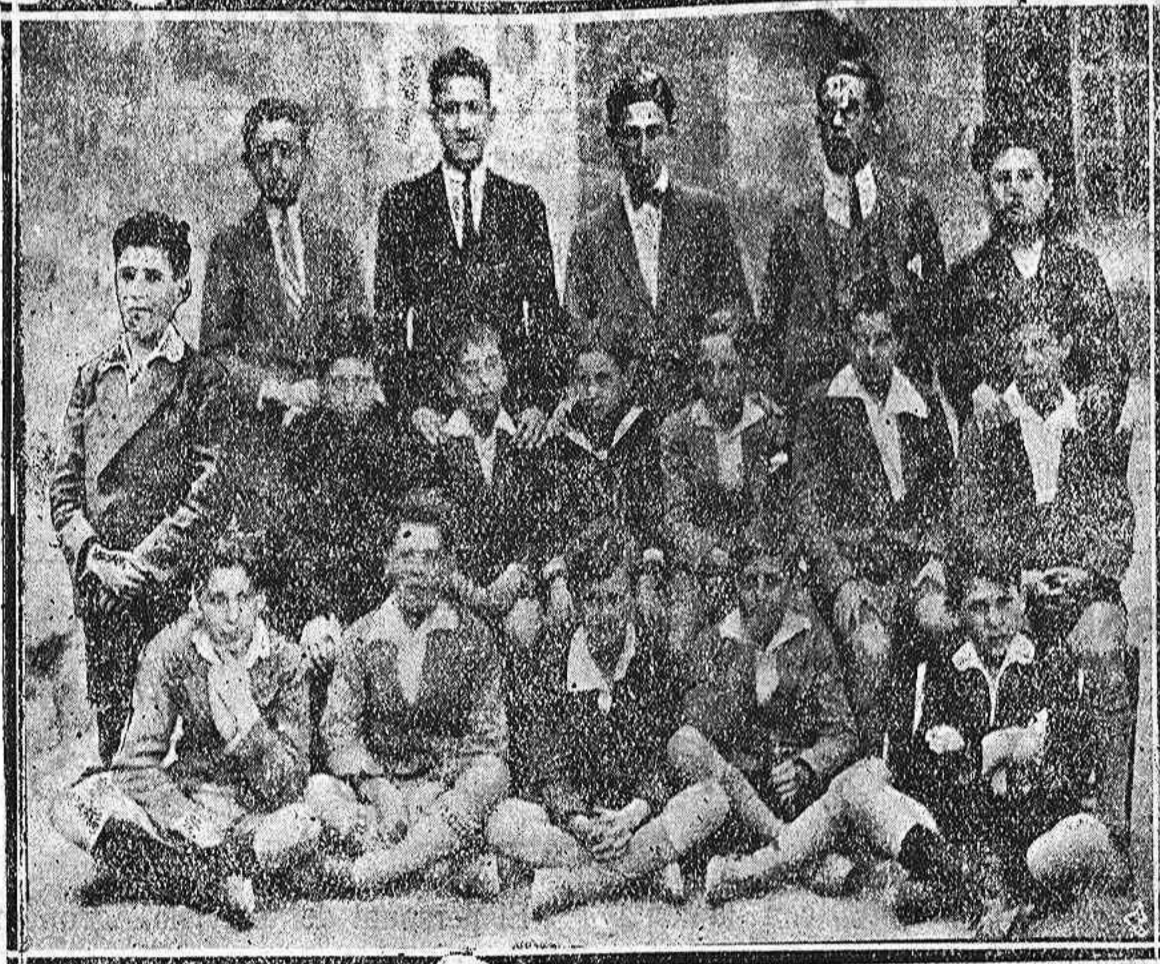
Diecisiete alumnos del Centro que ingresaron ayer en el Instituto. Presentaba veintidós

Palencia puede mostrarse orgullosa de contar con esta institución que ha de llevar la cultura palentina a todas las más gloriosas realidades.