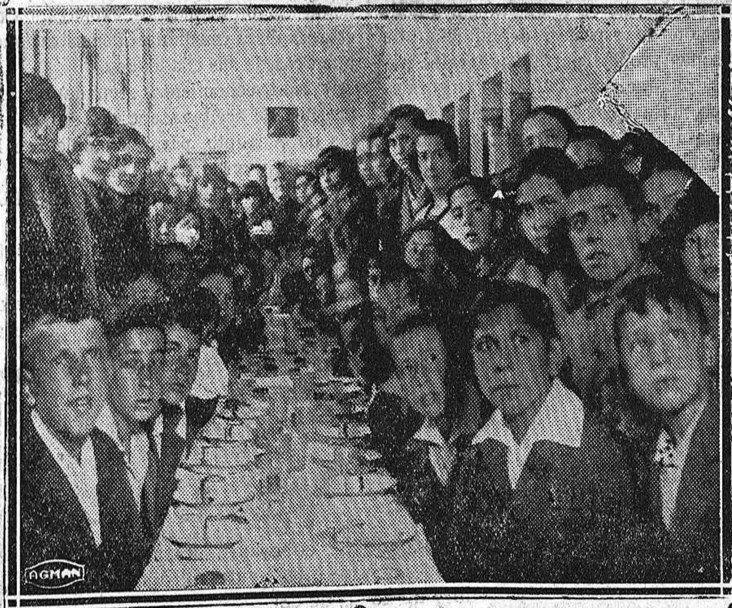
Niños que asistieron al Comedor Escolar durante el bien servido desayuno, con que fueron obsequiados ayer.