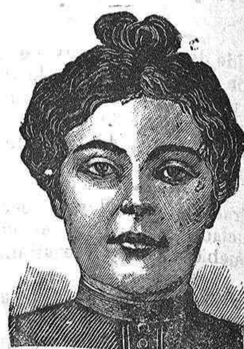
Después de 18 días de tratamiento