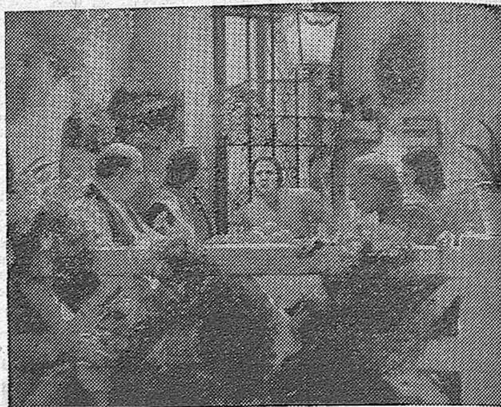
En «Mariguilla Terremoto» tienen nuestros artistas ocasión para mostrarse como los verdaderos «ases» de la pantalla española.