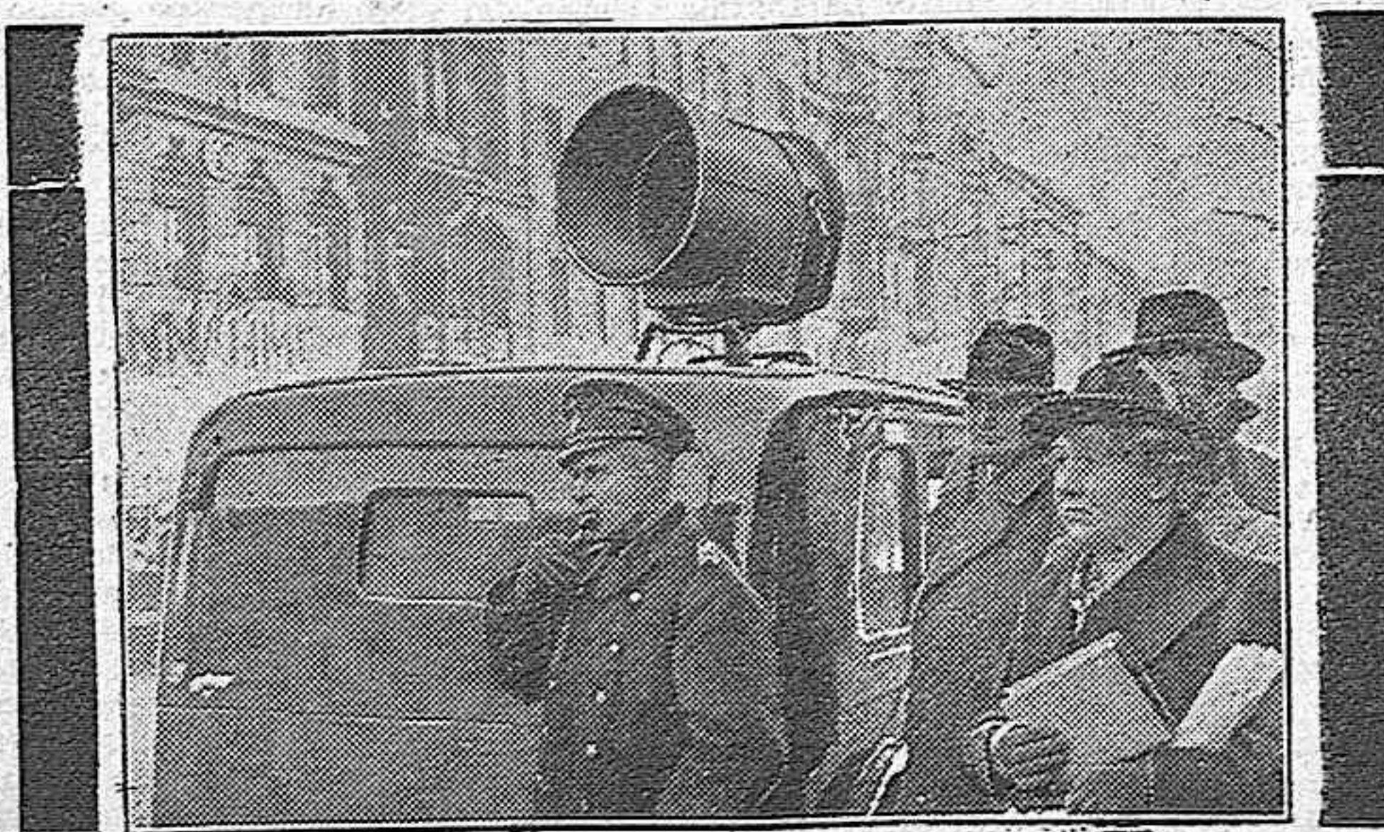
Altavoz para disciplina de circulación.—En Berlín la Policía emplea en puntos de tráfico importantes vehículos con altavoz, como medio de educación de los transeúntes.

Se estima muy probable una estabilización de la situación militar hasta la primavera próxima