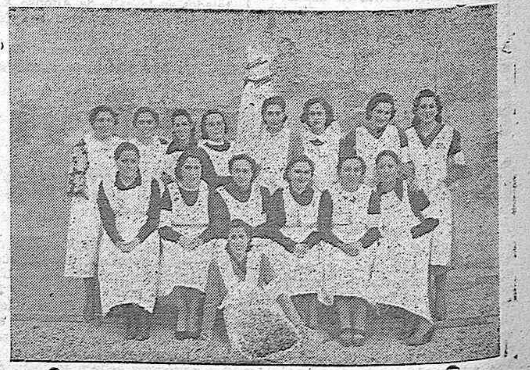
Un grupo escogido de la Juventud Femenina de A C de la parroquia de San Lázaro, después de la comida con que se obsequió a los pobres de la misma, con motivo de las solemnísimas fiestas de la Asamblea parroquial