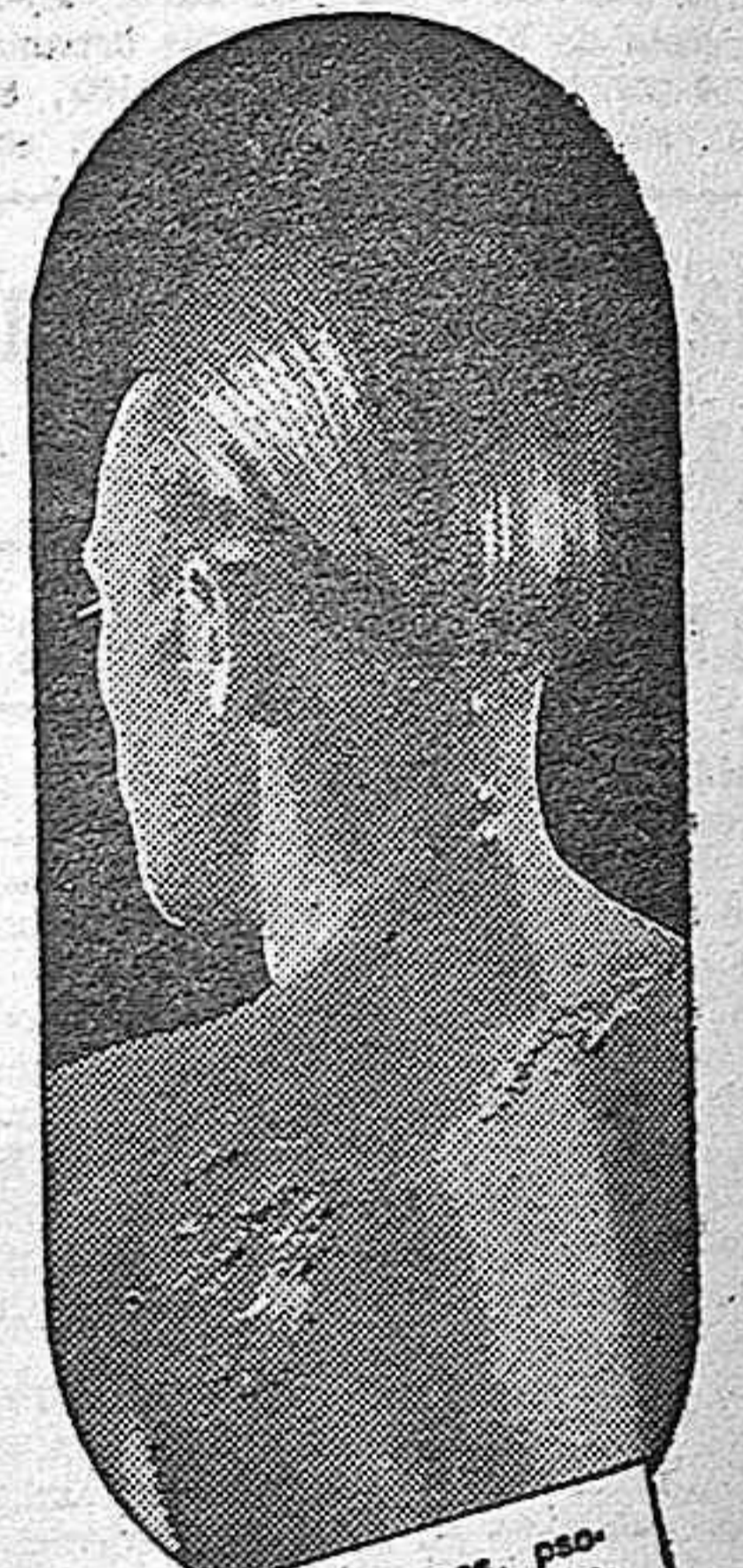
El eczema, herpes, psoriasis, etc., son manifestaciones de una sangre viciada que se debe purificar con el DEPURATIVO RICHELET

4 SOLO 4.25 (timbre aparte) le costará el frasco. Frasco grande... 7.80 (timbre aparte)