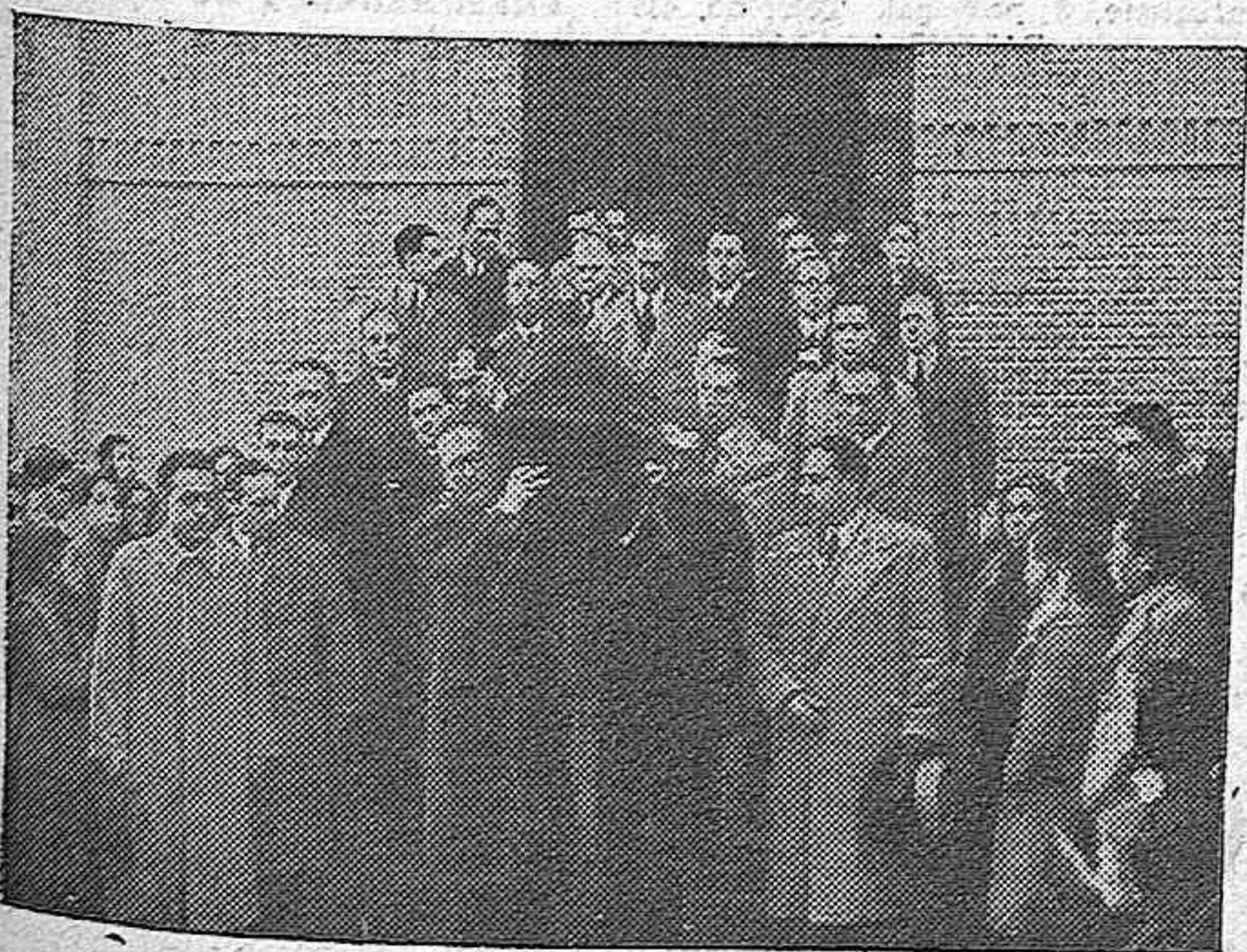
Antiguos alumnos del Colegio de Areneros, donde durante tantos años explicó el padre Pérez del Pulgar, sacan a hombros el sencillo féretro que encierra los restos del sabio jesuita