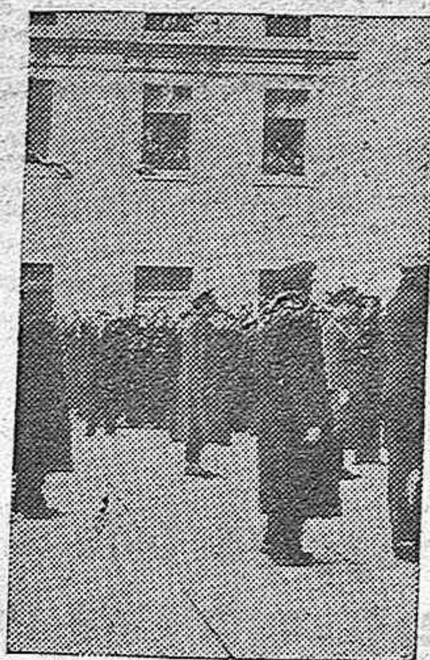
El Caudillo, tras el féretro de José Antonio, avanza por el Patio de los Reyes hacia el interior del Monasterio de El Escorial, entre el redoblar de tambores