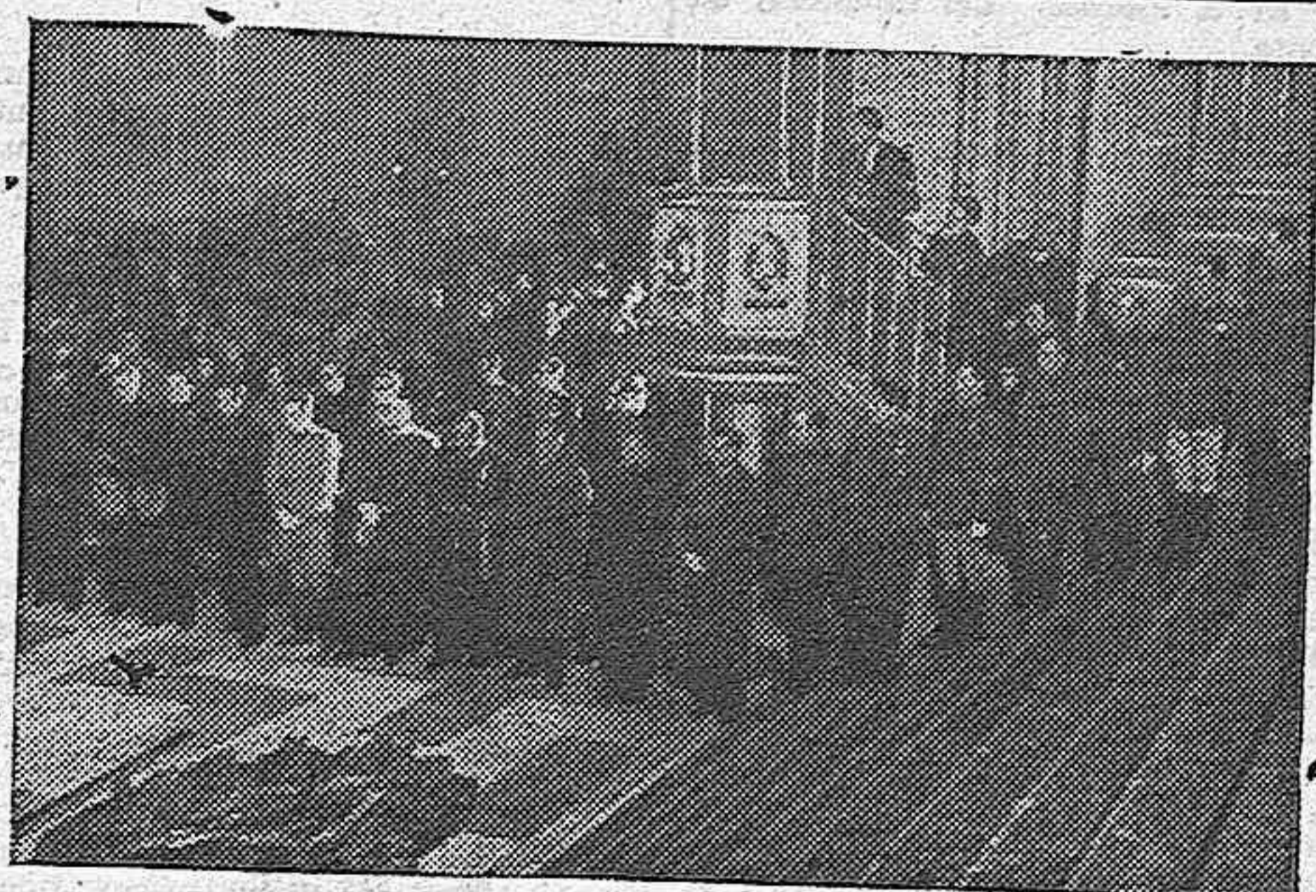
El Gobierno en pleno asiste, con emocionado silencio, a la ceremonia religiosa en el interior de la Basílica. En primer término, la monumental corona de bronce, ofrenda del Duce a José Antonio