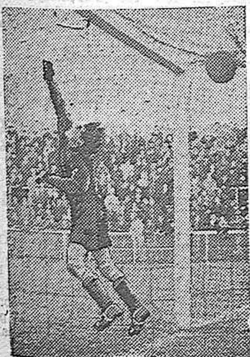
En el último encuentro en la plaza de España, Atlético Madrid, los «merengues» sucumbieron estrepitosamente. He aquí uno de los tantos marcados por los «colchoneros».