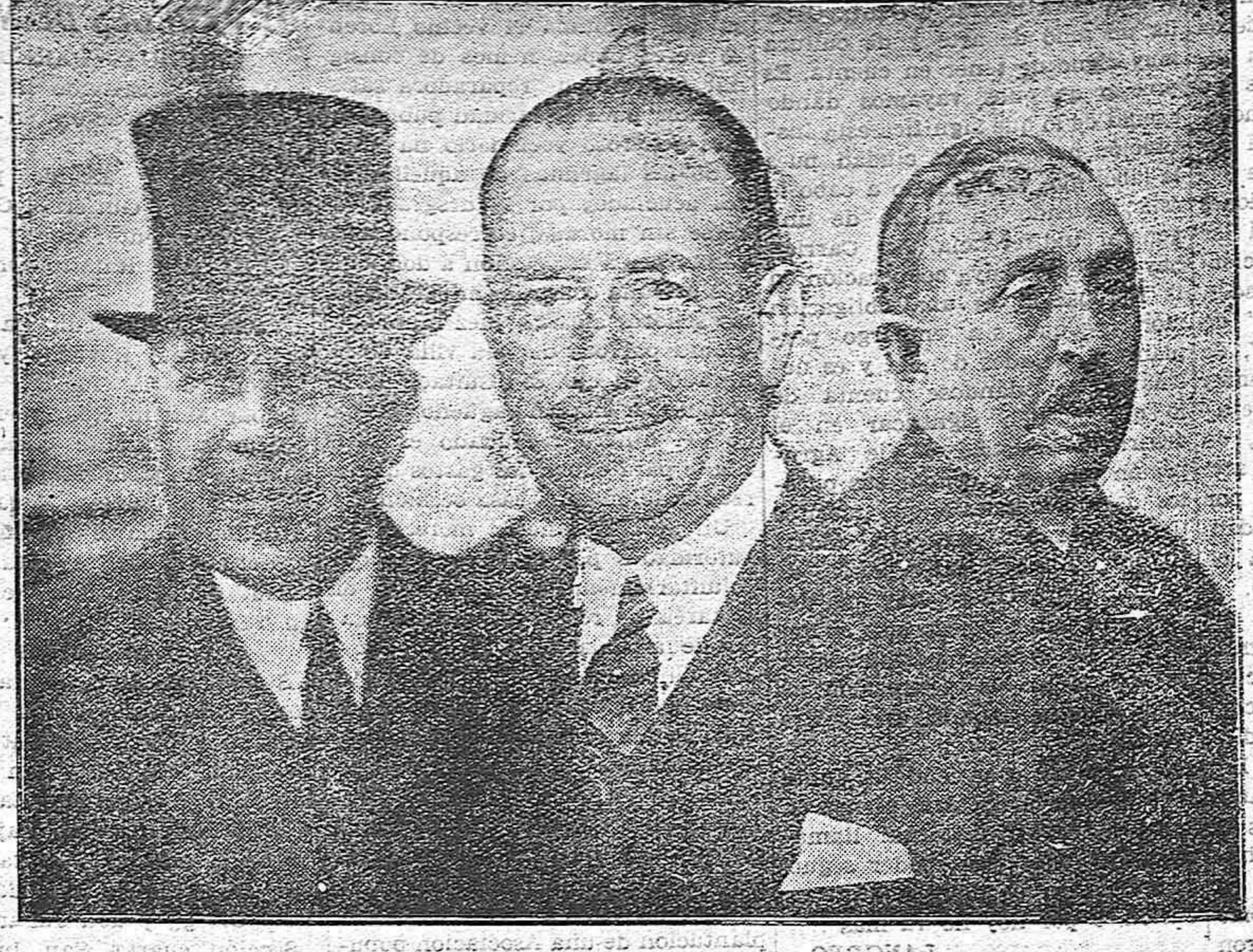
LOS NUEVOS MINISTROS. Nota de palpitante actualidad política: la solución de la crisis planteada en el Gabinete Berenguer, por dimisión del ministro de la Gobernación, general Marzo.

Ya nos sorprendió en el pasado verano otra modificación ministerial inesperada, por dimisión del ex ministro de Hacienda, señor Argüelles. Como entonces, se ha solucionado ahora la crisis con personalidades del mismo Gobierno.