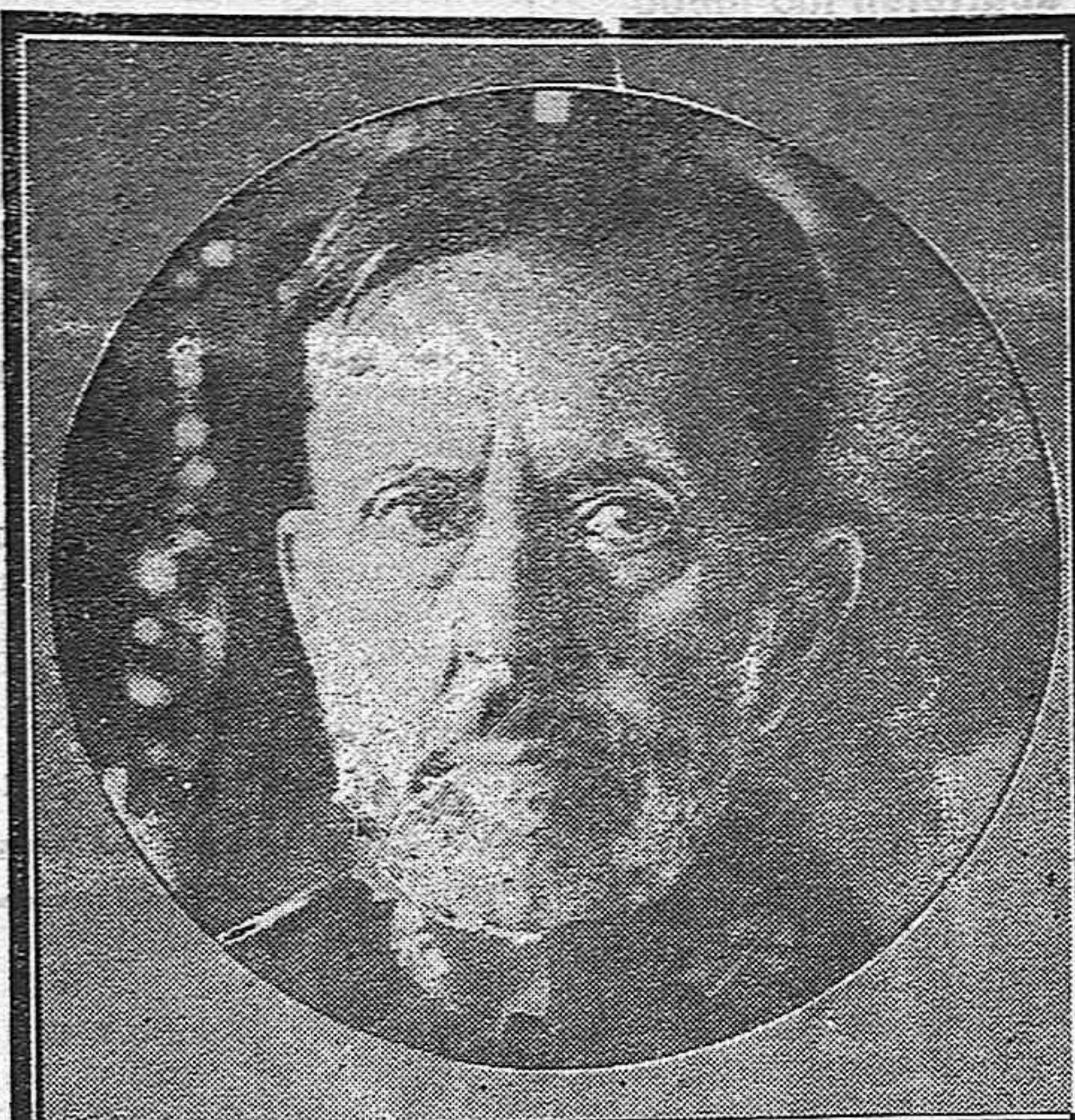
El ilustre y glorioso general Weyler, fallecido en la tarde de ayer