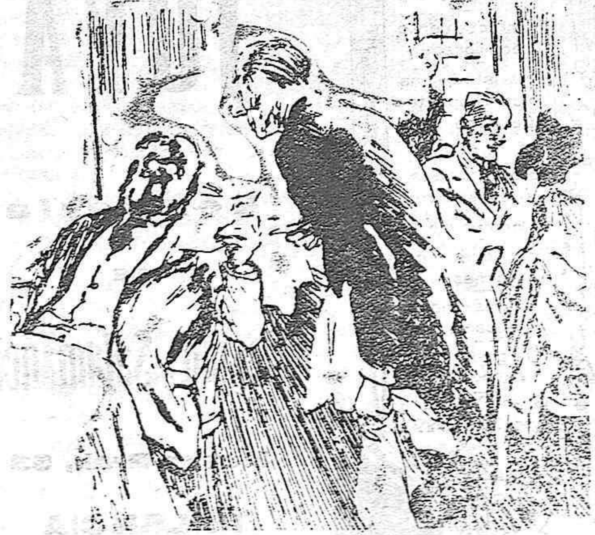
EL EXTRANJERO—(que no quiere revelar que ignora el idioma).—Trágame usted esas cuatro cosas que he marcado con lápiz en la lista. EL CAMARERO.—Muy bien, señor. Eso son los vinos y ahora ¿qué quiere el señor comer?

Al acto asistieron, además del Rey, el presidente y el ministro de Marina.