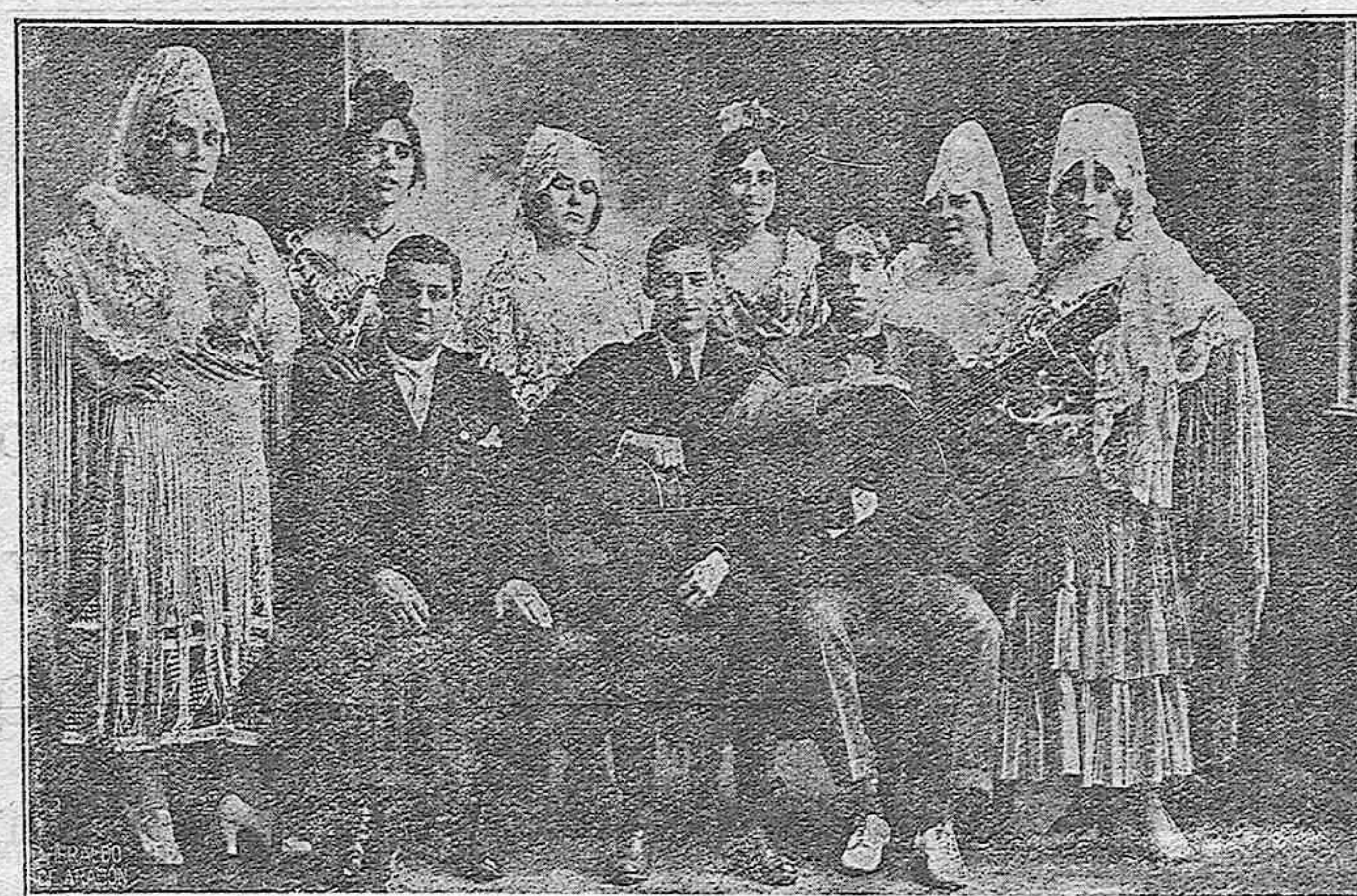
LOS COROS REGIONALES QUE ACTUARÁN EN LAS FERIAS PALENTINAS.—GRUPO SEVILLANO

Las personas que deseen contribuir a esta piadosa obra de caridad en favor de los pobres de Palencia, pueden enviar cuanto antes sus regalos a la Secretaría del Ayuntamiento (Negociado de festejos), para facilitar la organización.