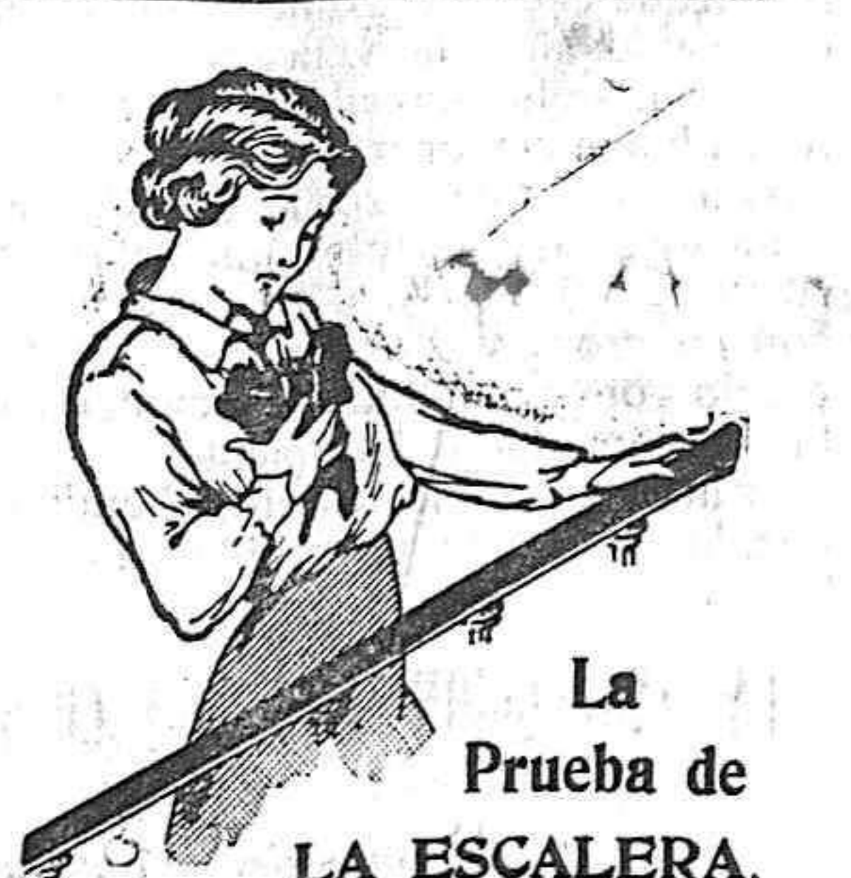
La Prueba de LA ESCALERA.

Por algo osentamos el título de independientes.