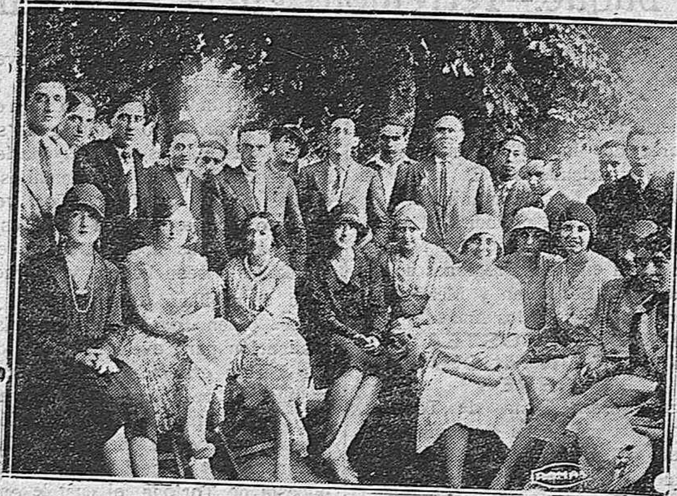
“DE LA GARDEN PARTY”. — Una peña de buenos amigos, entre los que figuran bellas muchachas de la localidad.

A pesar del tanteo, la delantera local no estuvo acertada en el remate. El dominio fué absoluto para el equipo local. Sus delanteros prodigaron los tiros, aunque poco precisos.