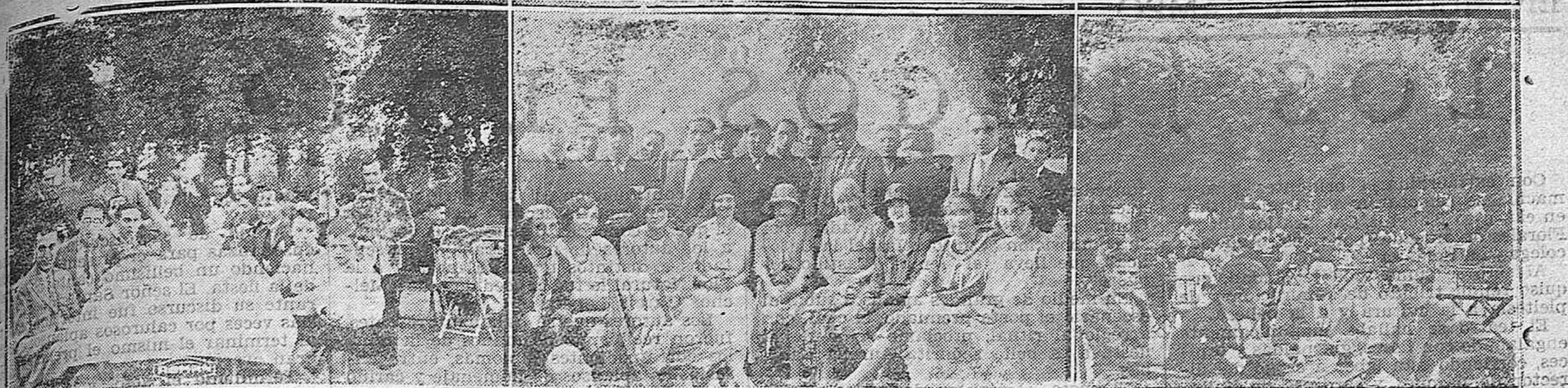
Tres aspectos de la animada "Garden Party" del sábado en la Huerta de Guadán.