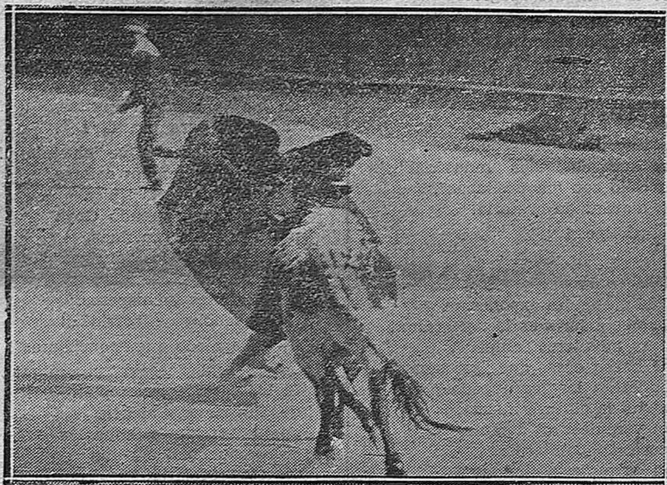
Con motivo de la cogida de Freg.—Freg toreando

El libro es a la vez una respuesta: está en una encrucijada, a fin de recoger todos los vientos y a fin de sompesar todos los gritos. Sin salirse de los números, esta actitud le obliga a comparar. Compara los kilómetros cuadrados, la producción, el capital, la Banca, la red de ferrocarriles, los pantanos, los canales, la riqueza minera, la de montes...—El autor coge a Castilla fuera de toda concepción histórica, en su amplitud geográfica, que considera étnica también. Y León es Castilla, de este modo. Extiende así el patrimonio que quiere enaltecer en esta obra, y son mucho mayores los venajes de vitalidad y fuerza que puede presentar a la loanza. Pero al aumentar el campo, se aumentan a la vez los divisores entre quienes se debe repartir la riqueza amontonada y la impresión de volumen que causan las estadísticas, a la hora del reparto pierde mucho. Ha sido una atención sentimental la que inspiró en este caso al señor Fernández Díez; sin ella, quizás su libro fuera una fuerza mayor. Siempre es de todos modos una fuerza, rotunda, enérgica, brava, que pone los valores de Castilla en la cumbre que merecen, y prueba que aún son bastantes, en cuanto se les fije orientación, para que la tierra vieja tan empapada de hazañas, recobre su fecunda juventud.