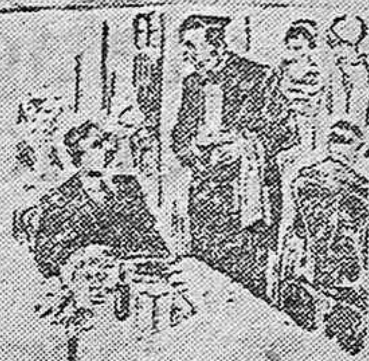
—Oiga, camarero, creo que no se debe hablar mal de nuestros mayores. —Eso dicen. —Bien. Entonces no digamos nada de este pol o.