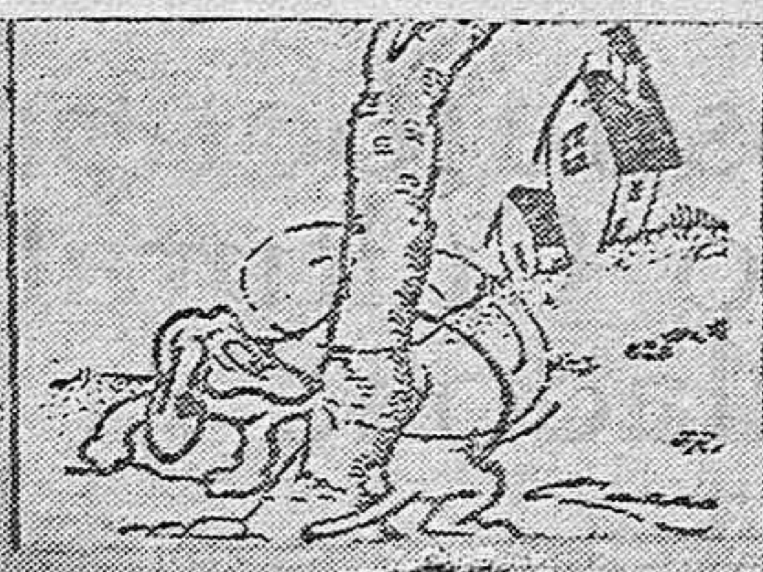
EL «BASSET». —Nada, que no lo gro alcanzarlo.