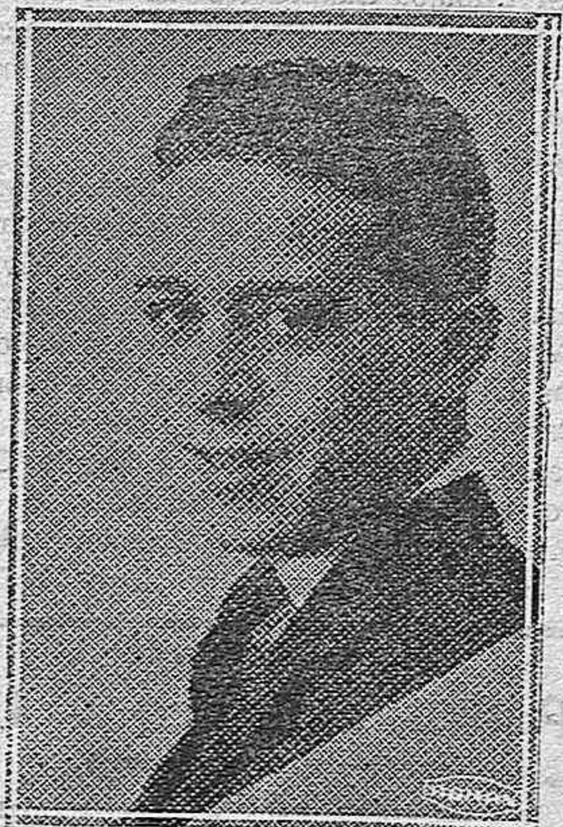
Los toreros que actuarán en esta feria Marcial Lalanda