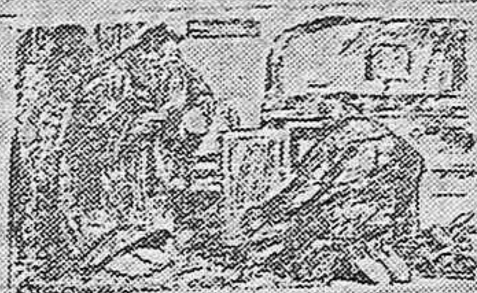
EL LADRON (a la dueña de la casa, que le ha colmado de improperios). — Bueno, señora; yo no he venido aquí para que usted me insulte...