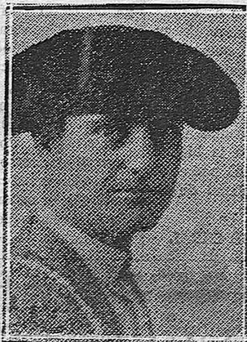
Los matadores que actuarán en las próximas ferias de San Antolín. NICANOR VILLALTA