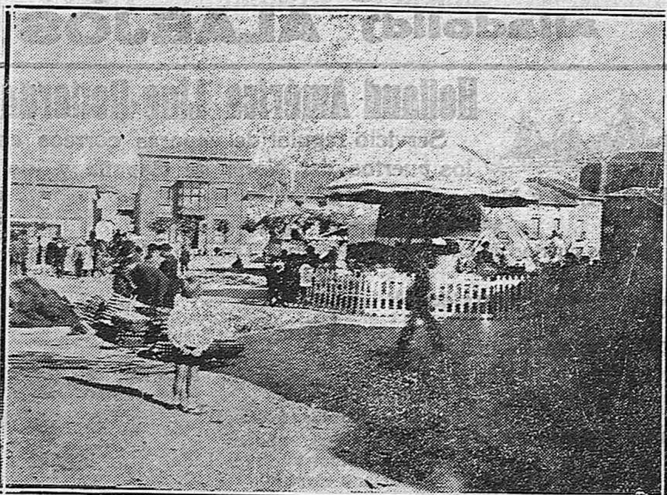
La Plaza Mayor de Osorno.—El día de la feria

Habrà el número de sesiones plenas que la ley orgánica determine. Solo en los casos que exijan reserva podrán celebrarse por las Cortes en pleno sesiones secretas.