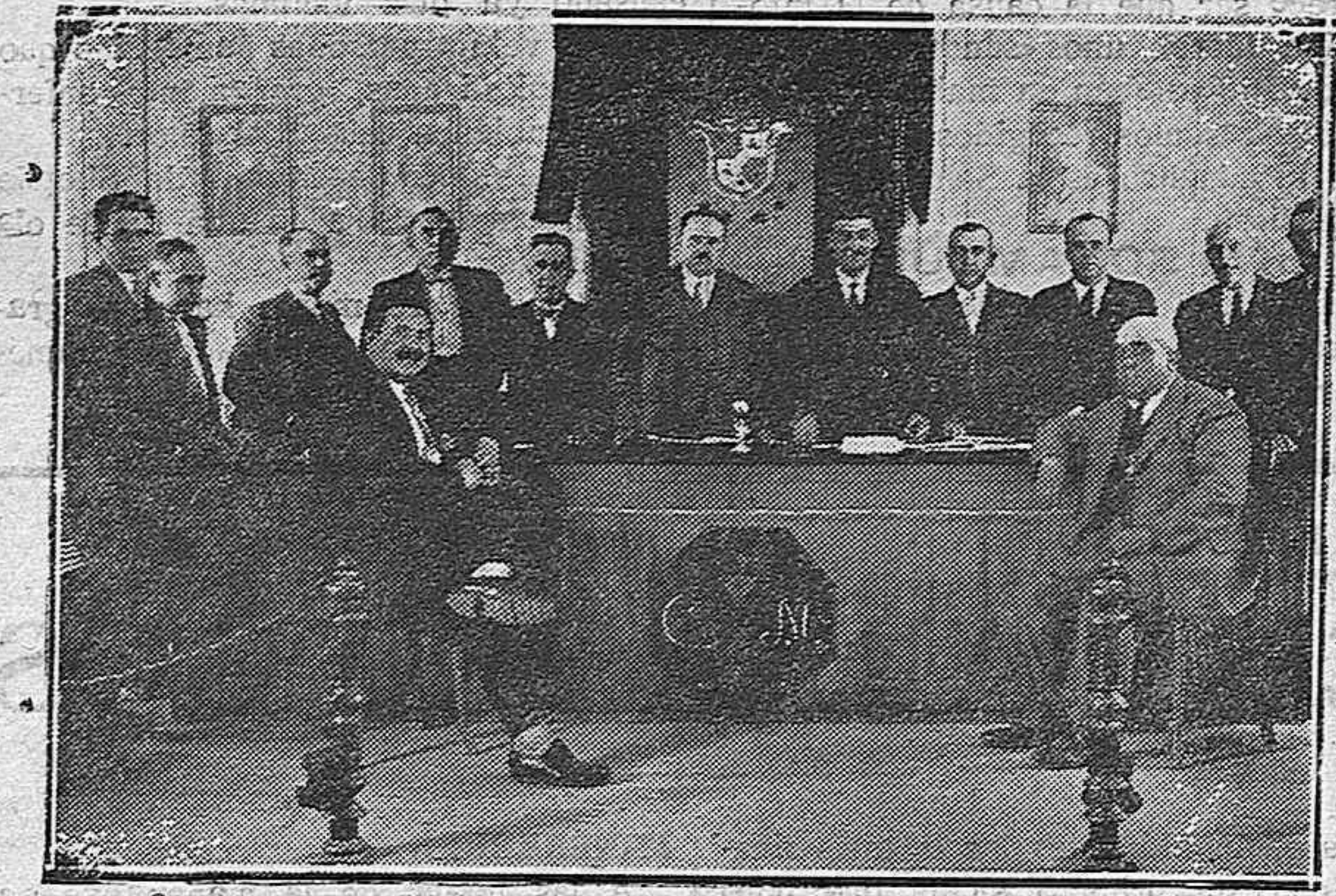
Algunos de los señores farmacéuticos palentinos que asistirán al congreso de Sevilla

En Farmacias y Droguerías, 1,00 pesetas. Por correo, 2 ptas. FARMACIA PUERTO, PLAZA SAN ILDEFONSO, 5, Madrid.