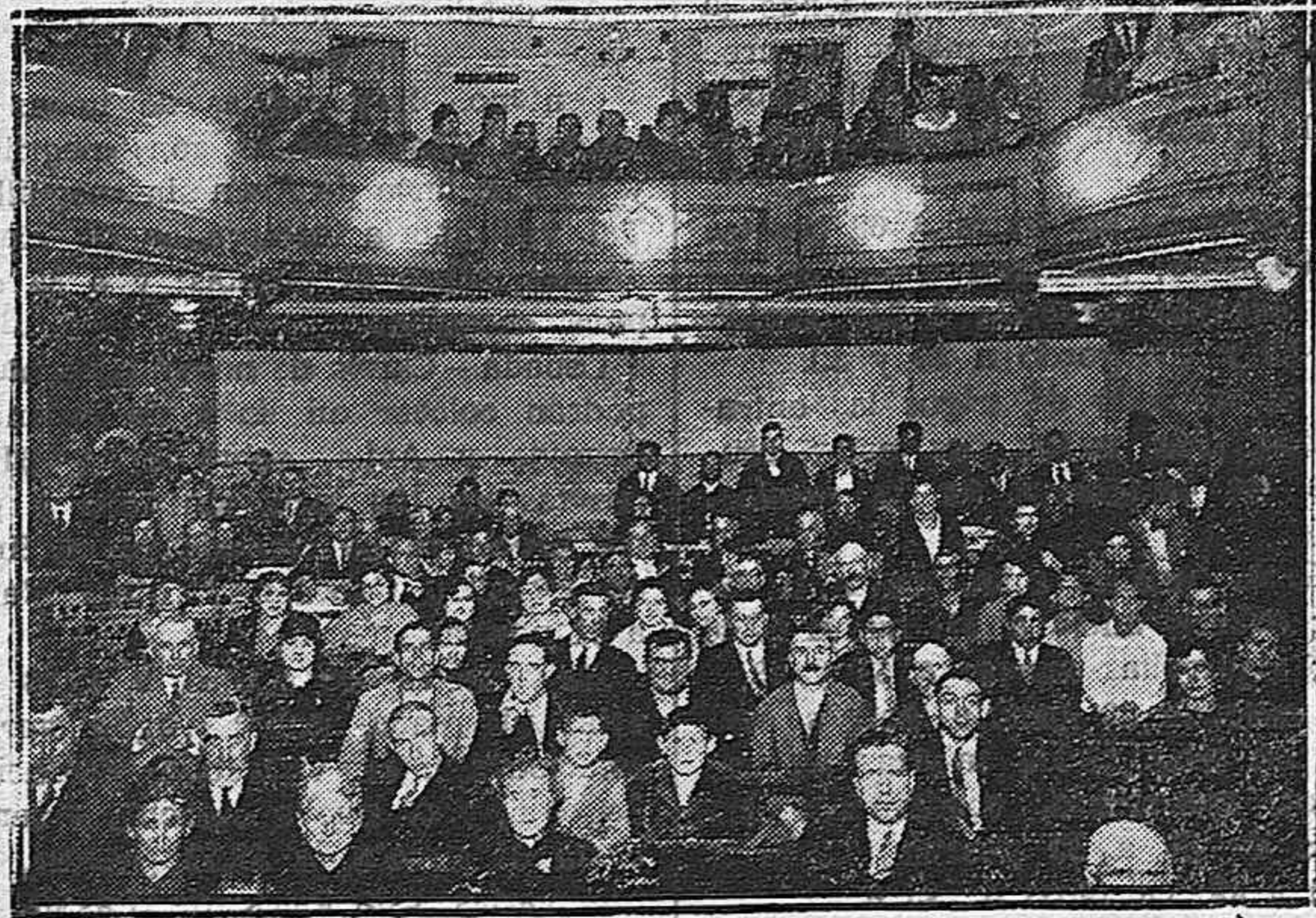
La sala del Cinema España durante la última conferencia.

La Junta provincial de Villarratel saca a pública subasta la caza de los te-