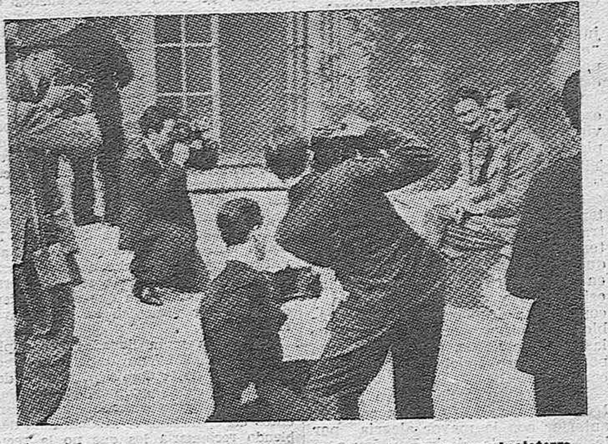
Los duques de Windsor, recién instalados de nuevo en Inglaterra, ofrecen sus más fotogénicas sonrisas a los operadores, que les rodean, o más bien les cercan, como puede apreciarse en la fotografía

Según informan dichos artículos, de tercera parte, con once millones de habitantes e importantes yacimientos de sal y petróleo. Añaden que el porcentaje de la población polaca en la Rusia Blanca, una de las regiones que pasará a depender de Moscú, es inferior al 5 por 100, y oscila del 5 al 5,50 por 100 en Ucrania occidental. — EFE.