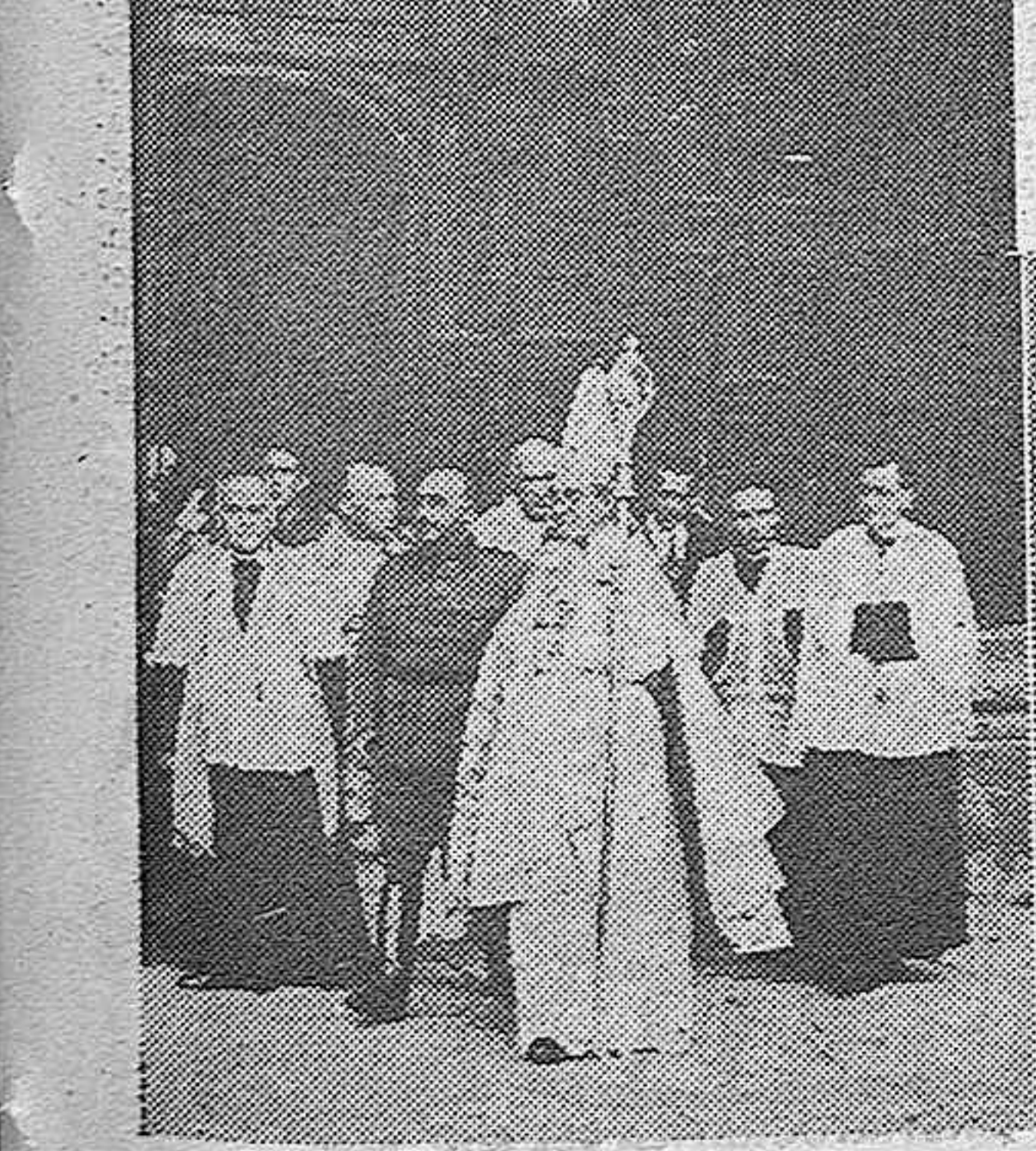
Oviedo recibió al Caudillo con muestras de adhesión inquebrantable. Las "fotos" recogen los momentos en que S. E. Excelencia abandona la Catedral, acompañado por el alto clero catedralicio, después de haber asistido al "Tedeum" y cuando se dirige, a pie, a la Diputación, entre constantes e indescriptibles aclamaciones de la multitud