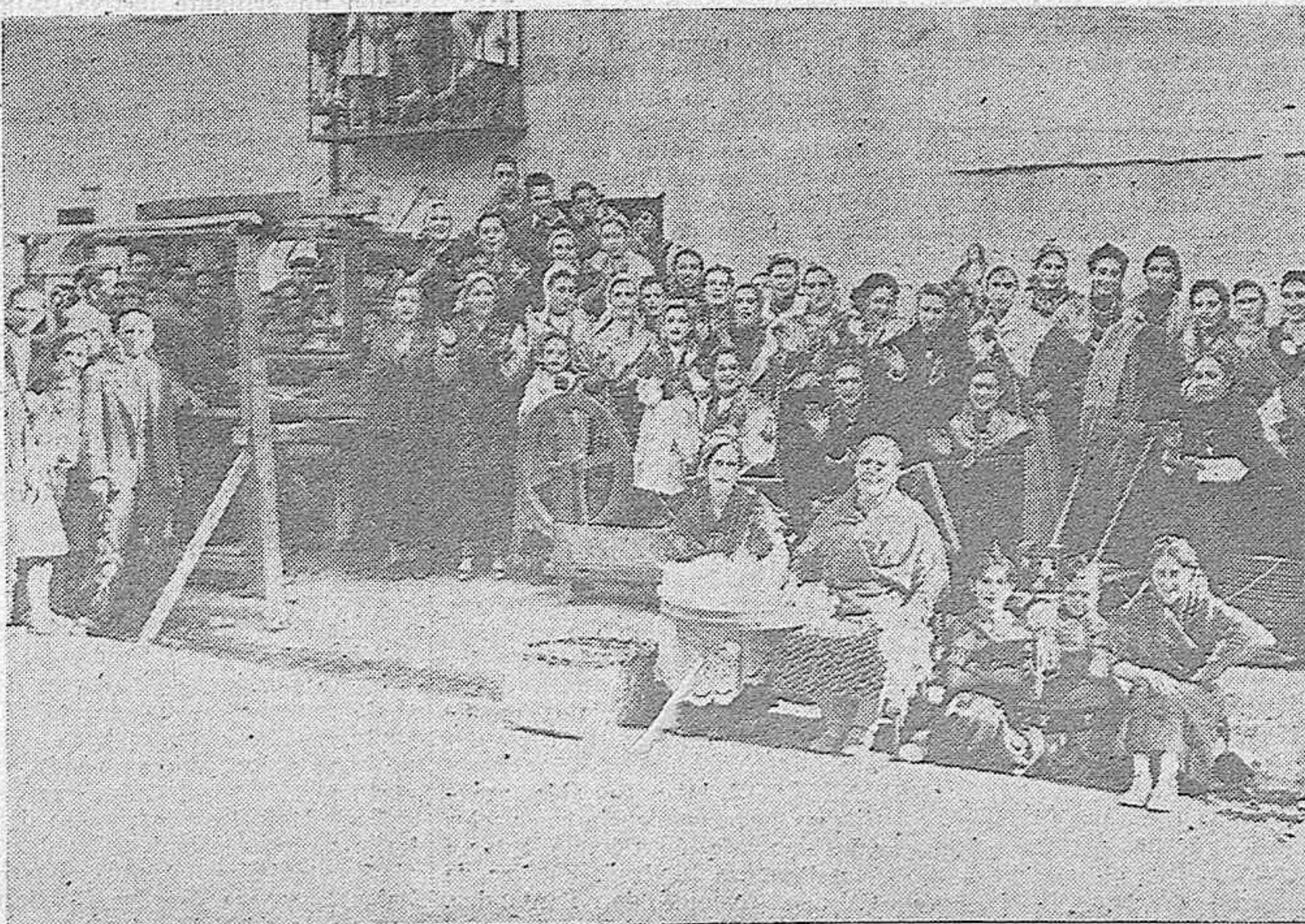
Con ocasión de las fiestas de San Antolin, se han celebrado verbenas en los diversos barrios de la Ciudad. En el de la Puebla, hubo una nota en extremo simpática, que reproduce esta fotografía, al instalarse un telar de mano, semejante a los que dieron a nuestra fabricación de mantas, el prestigio que hoy conserva