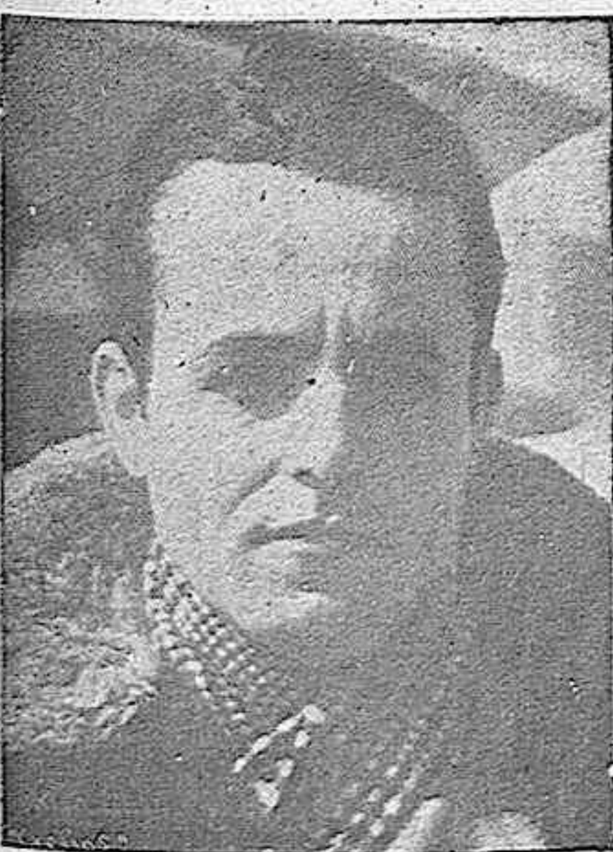
El Conde Hagemburg, maestro de vuelos acrobáticos en Alemania