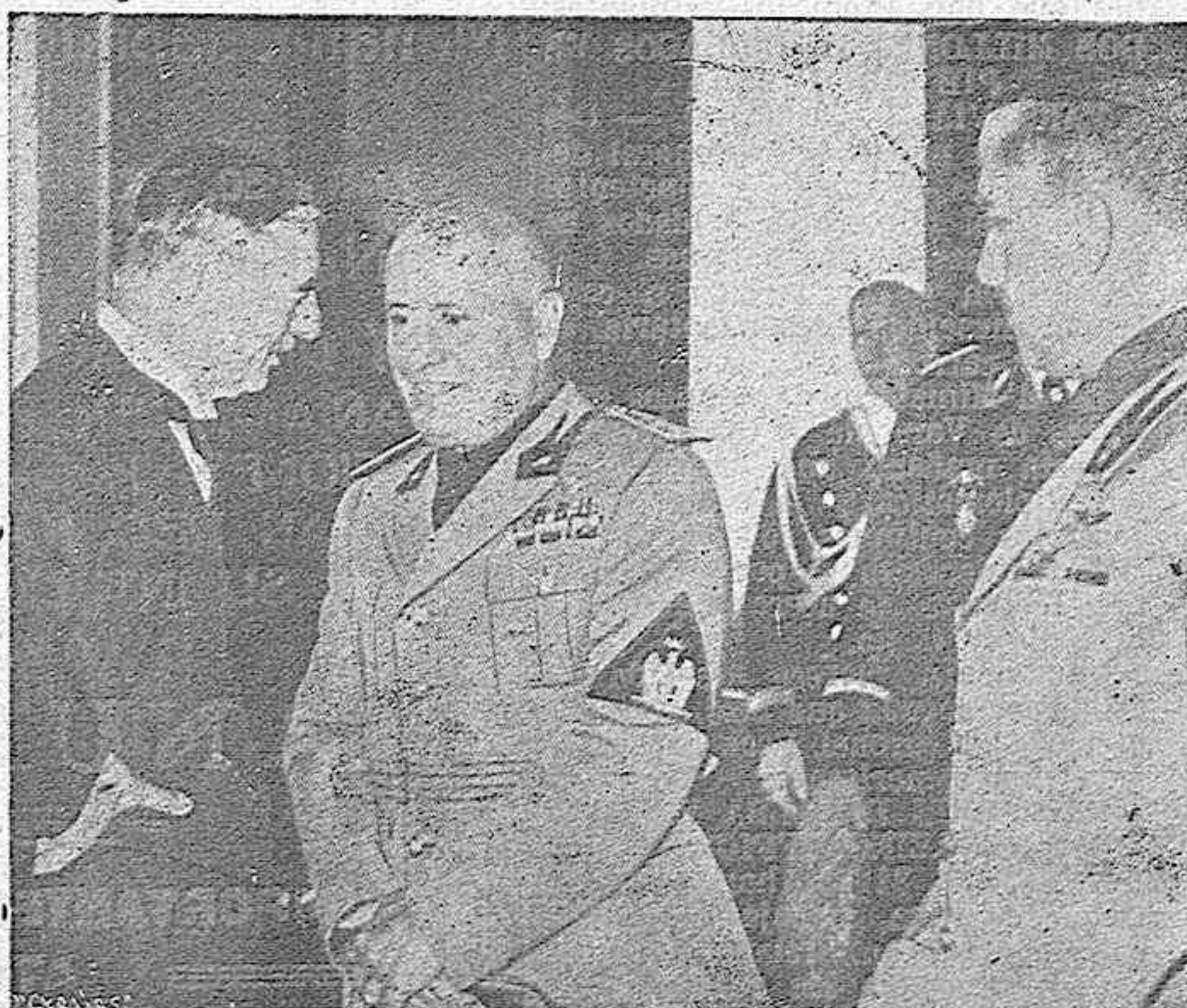
El Duce conversa con Chamberlain en un intervalo de la histórica jornada de Munich, cuando Mussolini evitó una guerra

El Gobierno acordó por ende una parte del proyecto de bre exacciones municipales, atendido a la petición formulada por la Asamblea de Ayuntamientos, tendiendo a mejorar la situación de las Haciendas locales.