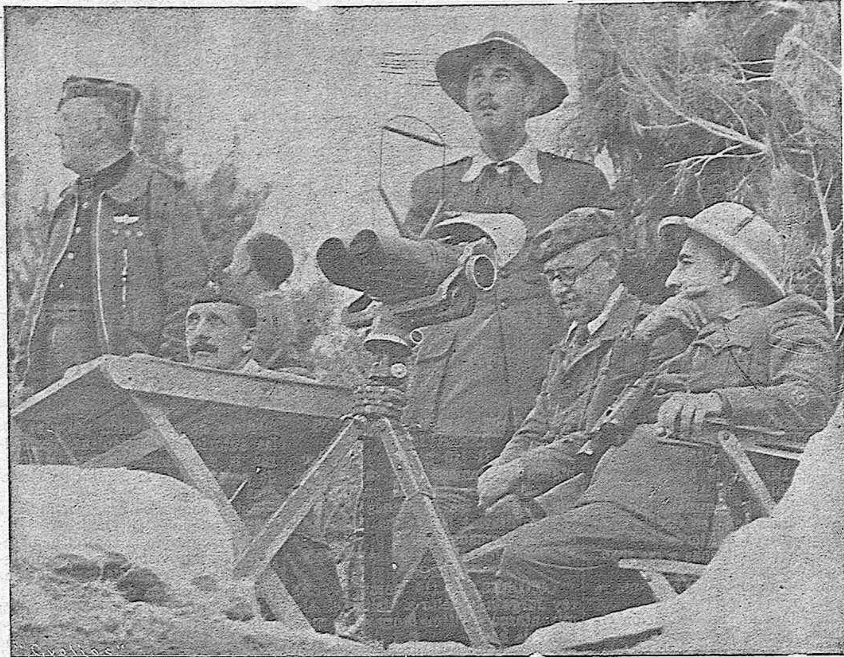
EL NUEVO JEFE DEL ALTO ESTADO MAYOR. Ayer apareció en el «Boletín Oficial» la designación del general D. Juan Vigón para el cargo de jefe del Alto Estado Mayor del Ejército, Marina y Aire. En la fotografía aparece el Sr. Vigón, sentado al lado del Caudillo, durante una de las batallas en el sector del Ebro

Berruguete, 8, principal. Teléfono 435. — PALENCIA