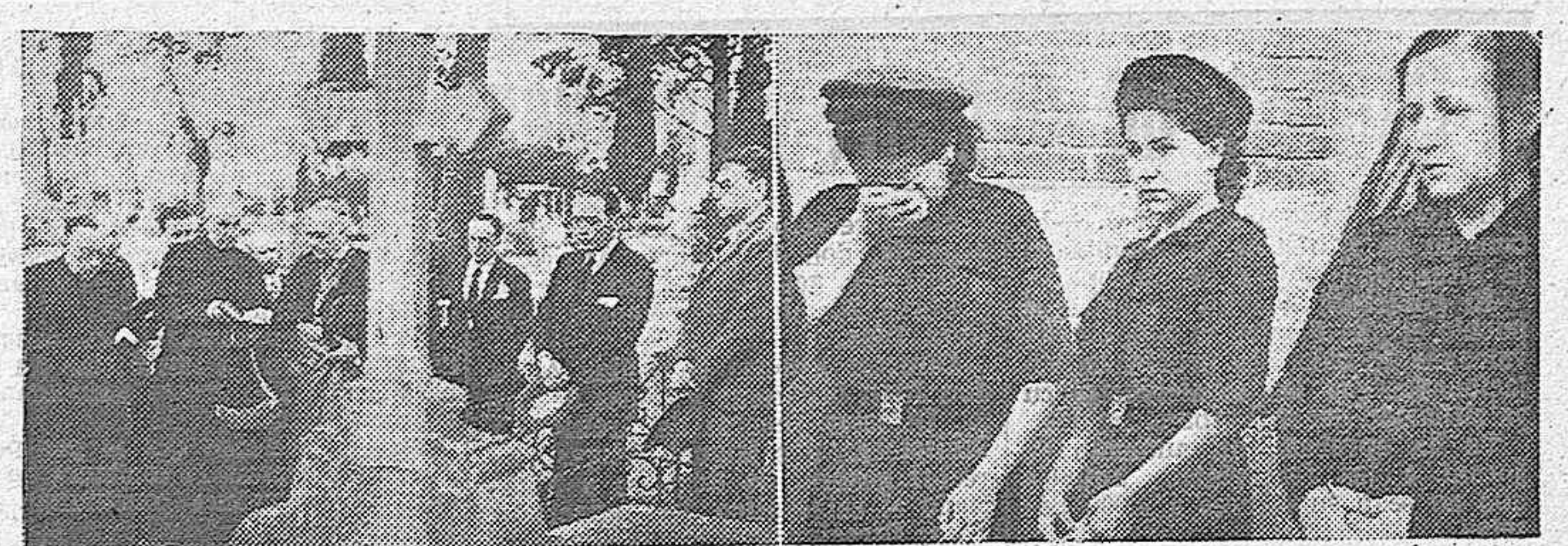
Días atrás se han celebrado en Madrid piadosos actos en recuerdo de los periodistas caídos durante la guerra por defender los ideales sacrosantos de la Patria. La fotografía reproduce dos momentos de estos actos, mientras se depositaban coronas en el Cementerio sobre las tumbas de las víctimas, con asistencia de familiares y compañeros.