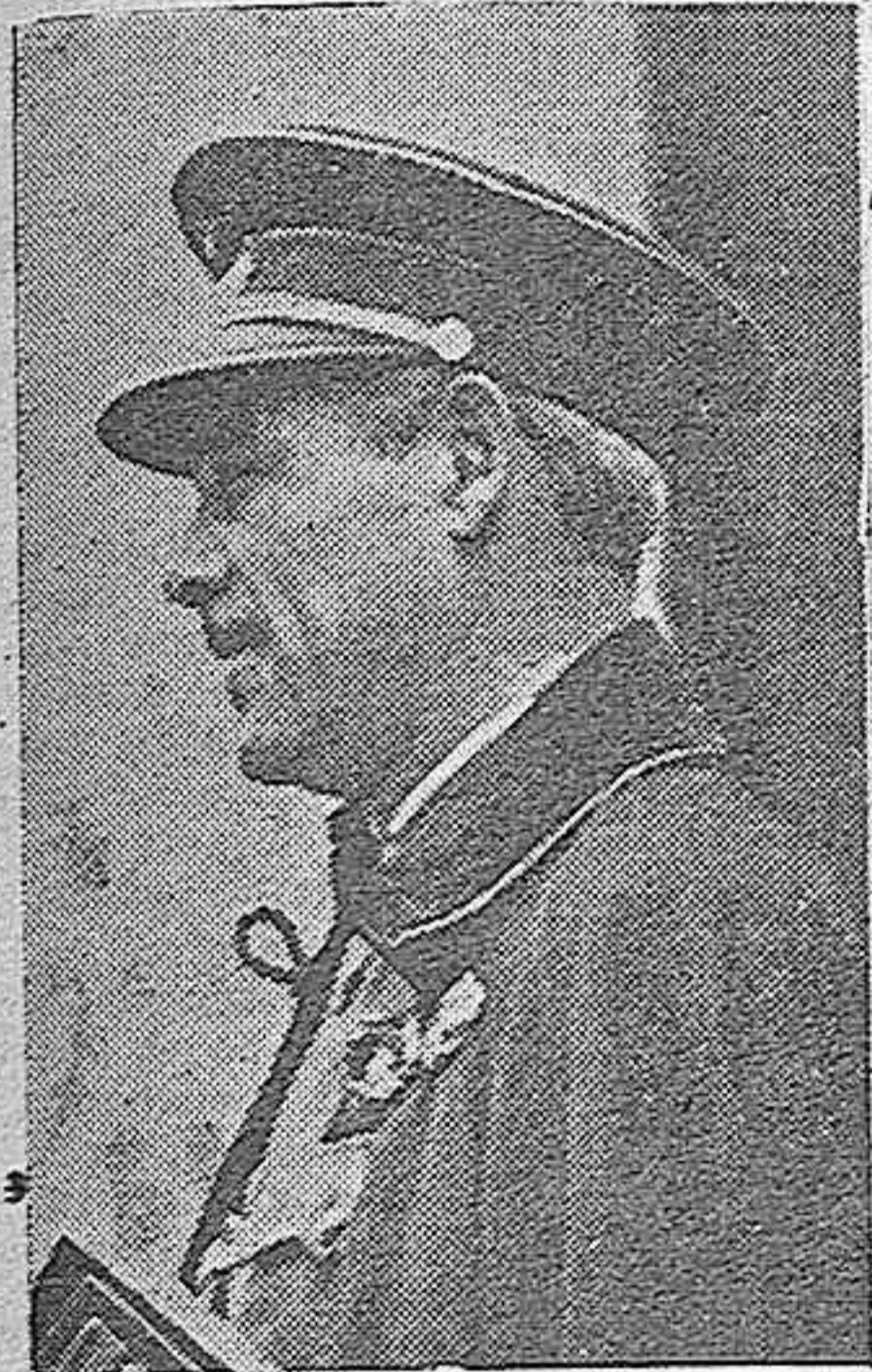
El general Asensio a quien el Caudillo ha nombrado Alto Comisario de España en Marruecos.