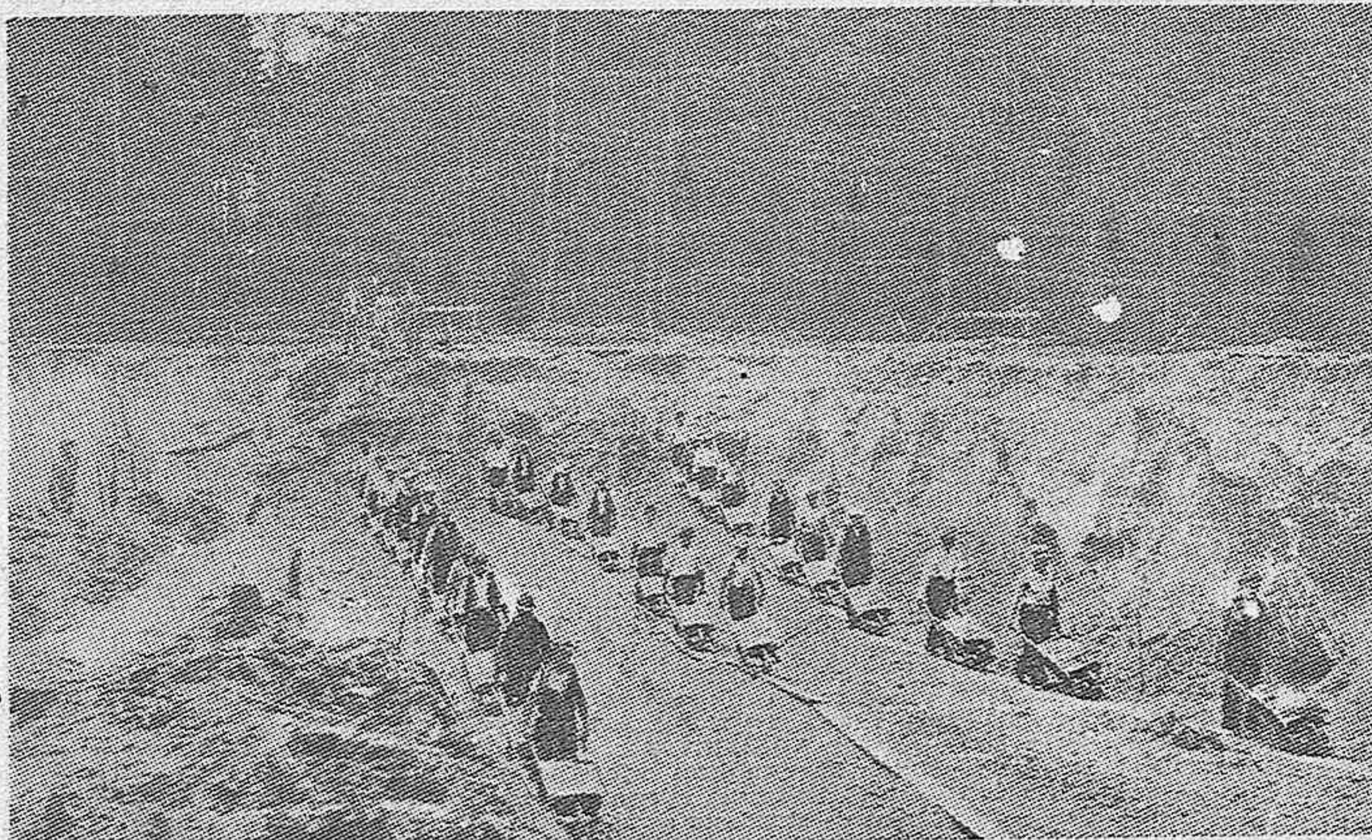
En el corazón de las selvas más recónditas de Polonia miles de obreros trabajan para trasladar las instalaciones industriales de guerra, situadas hasta ahora en el llamado triángulo de seguridad de Teschen junto a lo que fue Checoslovaquia.