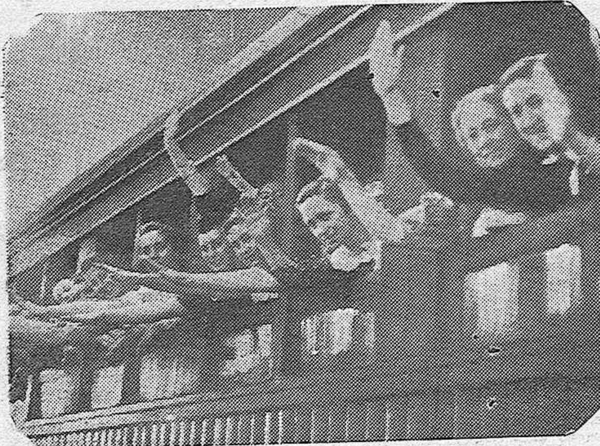
El domingo salió de Madrid la segunda peregrinación para visitar a la Virgen del Pilar, en acción de gracia por la liberación. La presente fotografía recoge un momento de la partida.