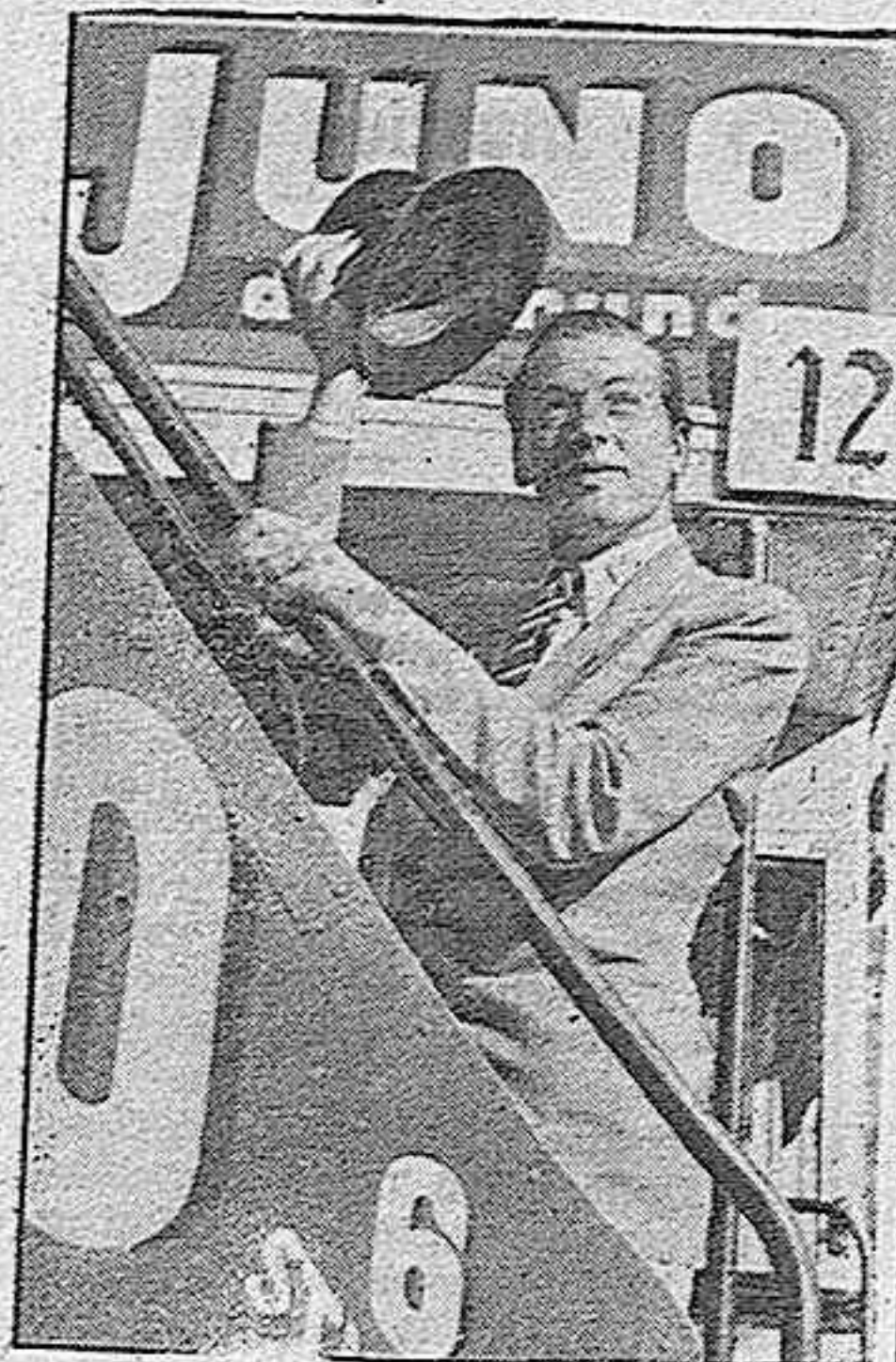
—¿...?— Una revelación en la cinematografía mundial.

La moda femenina de las "estrellas" del films POR LAS SALAS DEL CINEMA