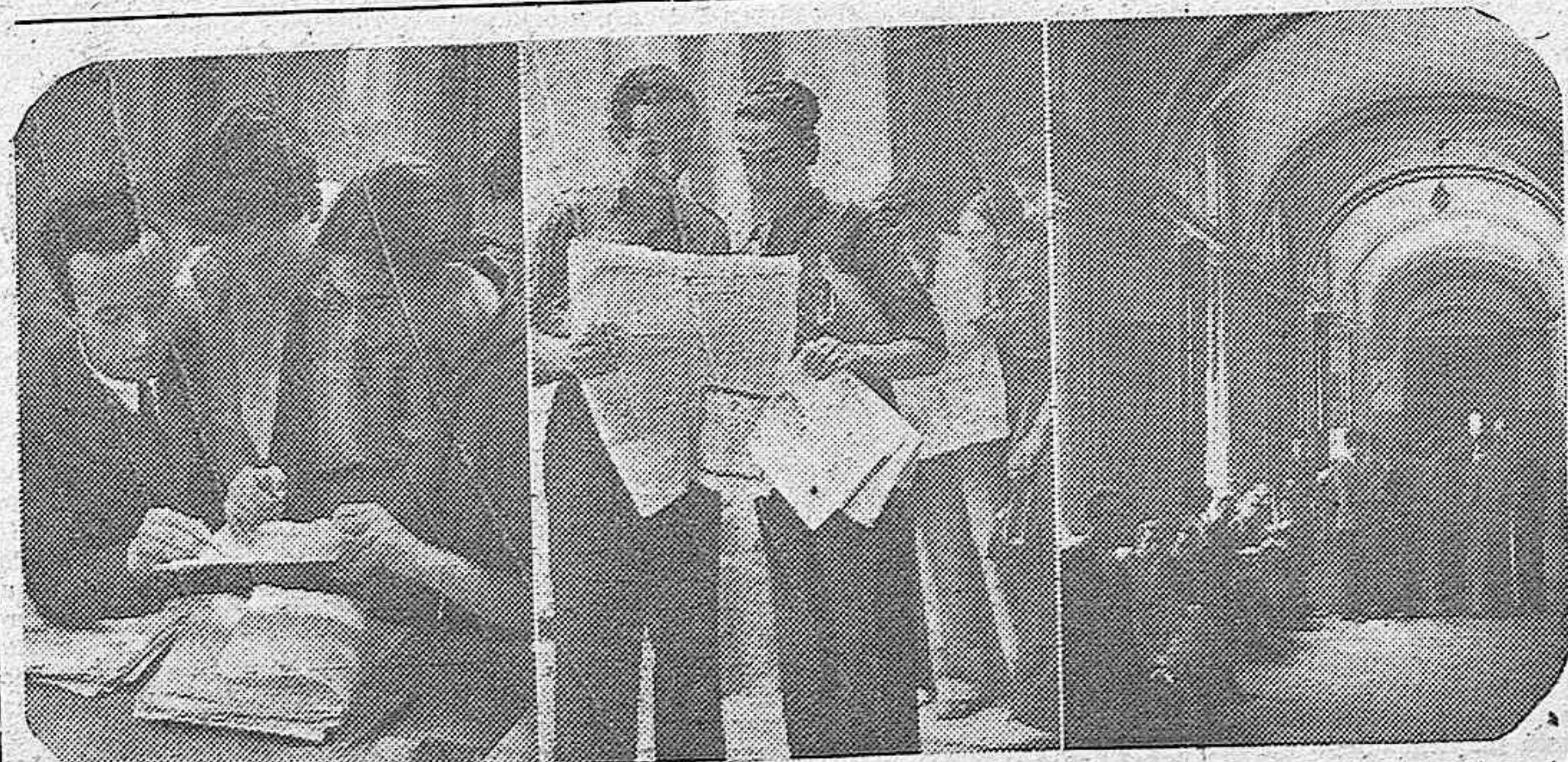
Con el anuncio de los próximos exámenes vuelve la actividad en los centros de enseñanzas. Aquí varios grupos de estudiantes madrileños vuelven a animar los pasillos de las aulas mientras comentan las últimas noticias y consultan los apuntes que ya en a ha comenzado a dictar el profesor.