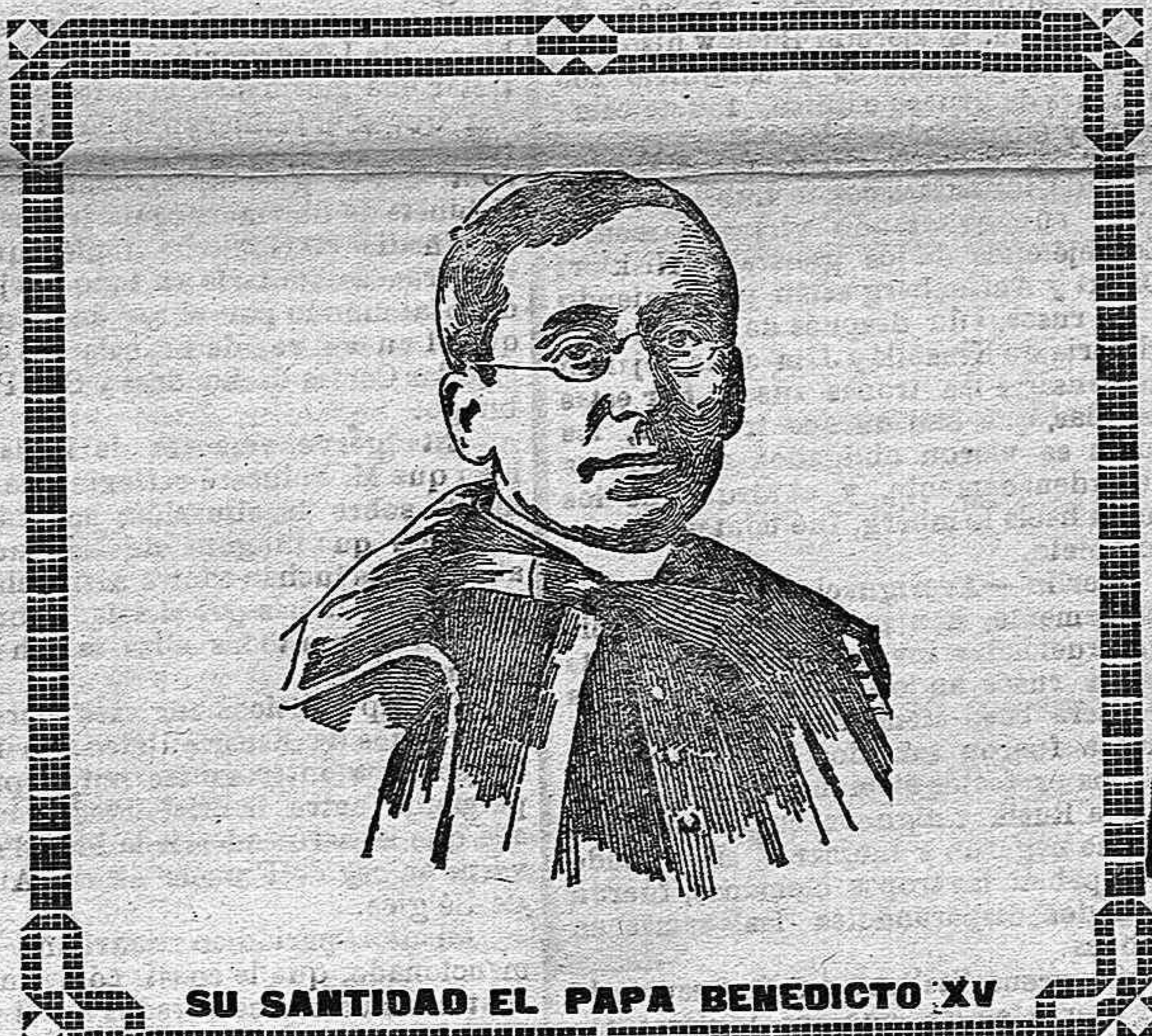
SU SANTIDAD EL PAPA BENEDICTO XV

Además del presidente del Consejo, despacharon esta mañana con el Rey