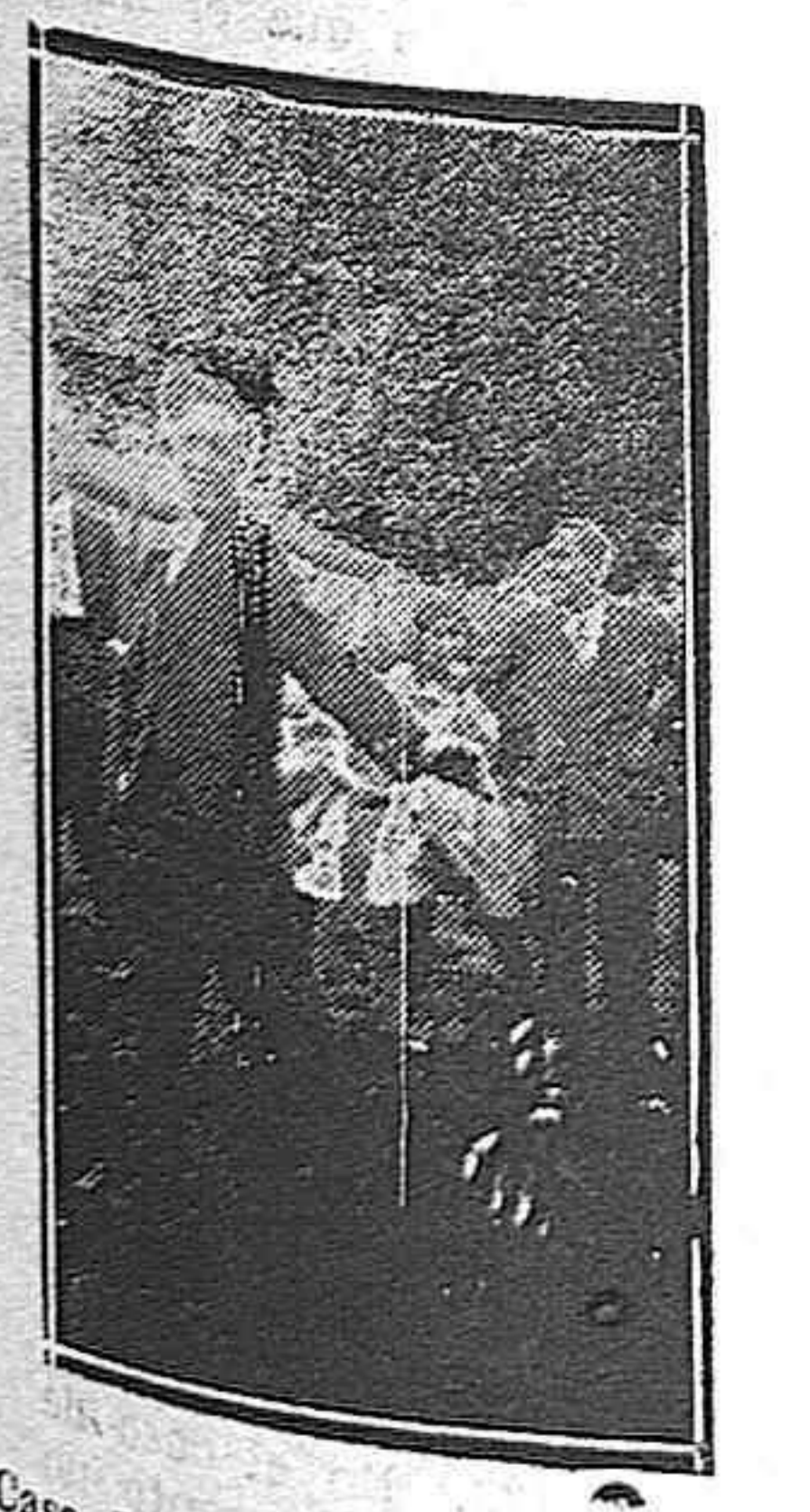
Casa de Palencia en Santander. Jugando a la barra