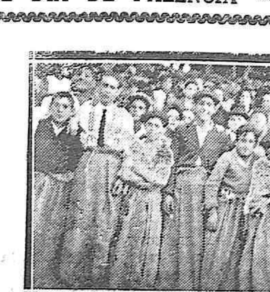
CASA DE PALENCIA EN SANTANDER.—De las fiestas de San Antolín. Carreras en sacos.