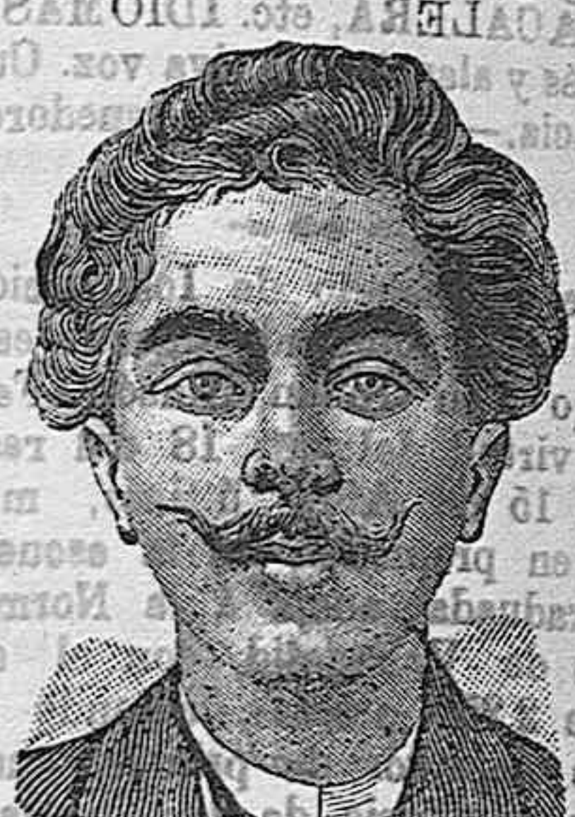
Después de 15 días de tratamiento