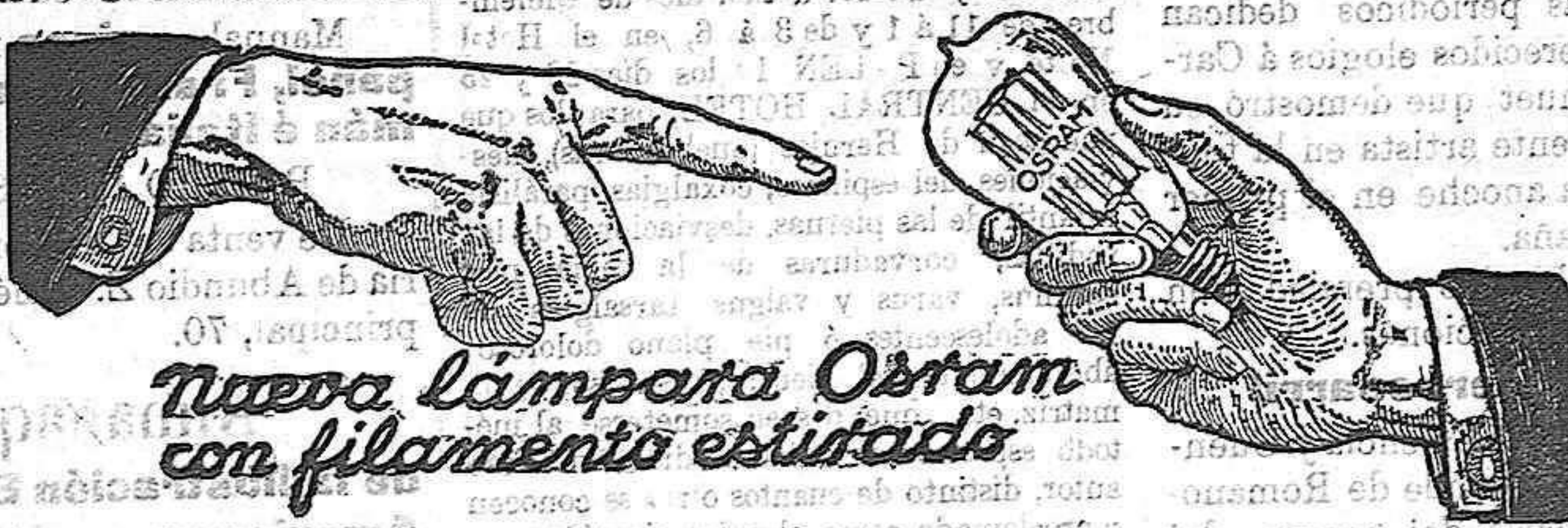
Nueva lámpara Osram con filamento estirado

Aventadoras, Gradas, Rodillos, Norias, Bombas