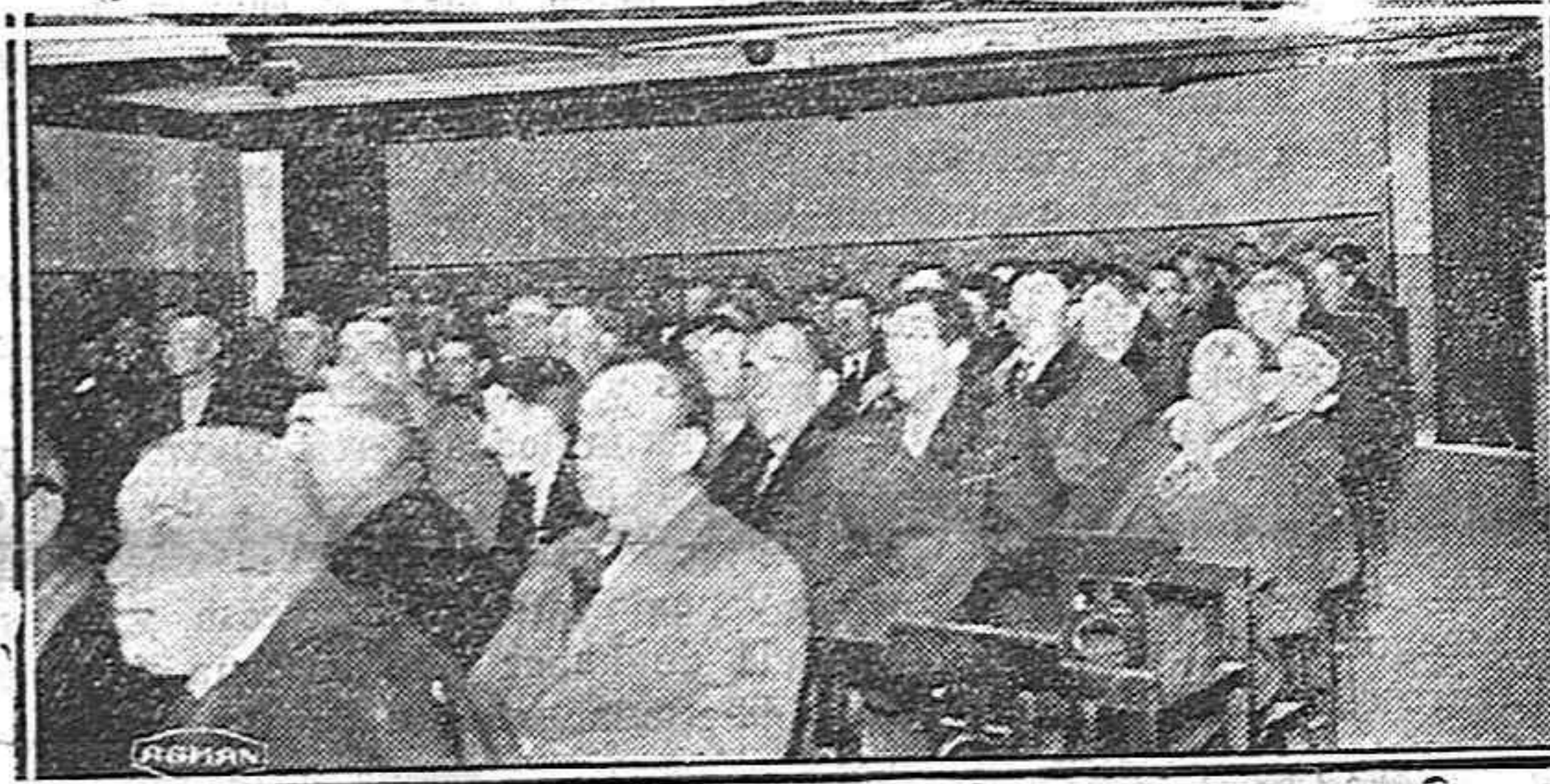
EN EL CINEMA ESPAÑA.—Un aspecto parcial de la sala en la Asamblea de esta mañana

Ante este estado de cosas—prosigue el señor Nevares—no podemos cruzarnos de brazos, y es preciso buscar a la crisis una pronta solución, que comprenda los aspectos: solución inmediata, que es lograr vencer estas dificultades, contando con