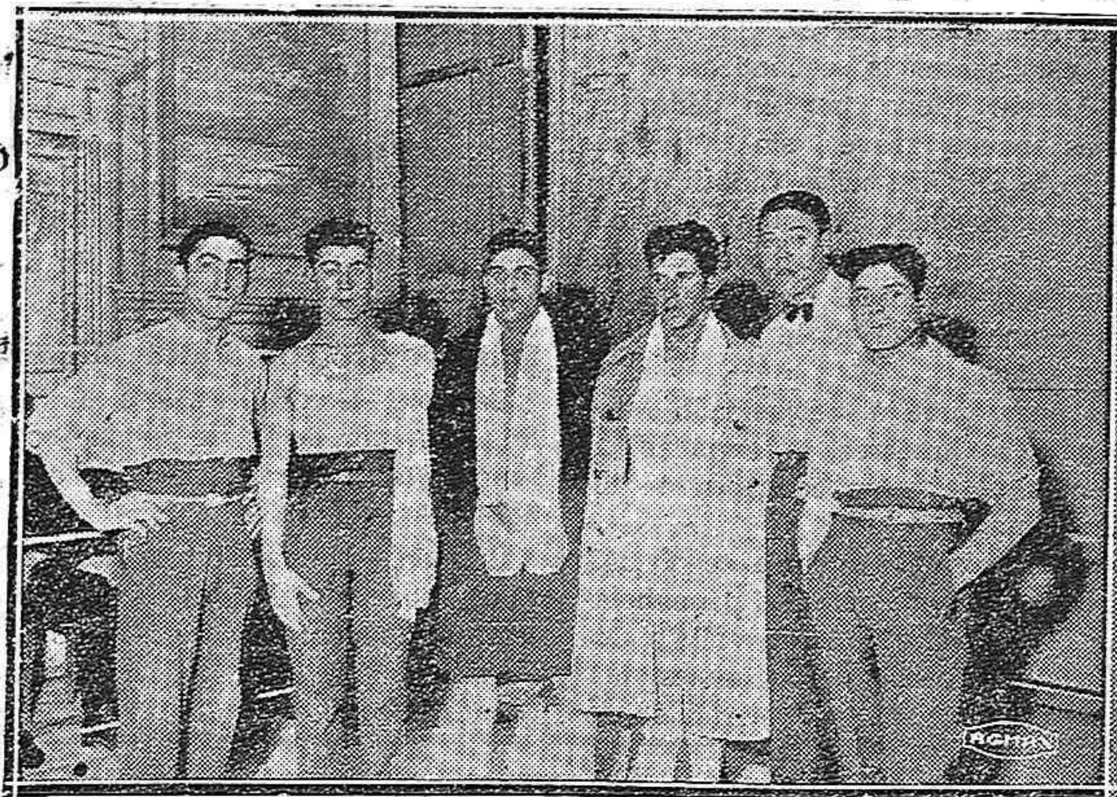
DEL BOXEO.-Algunos púgiles esperando el combate

los cuales van a estrellarse en la guardia de Salagre, que contraataca con ímpetu y hace perder el dominio a Delckani, que se refugia en las cuerdas.