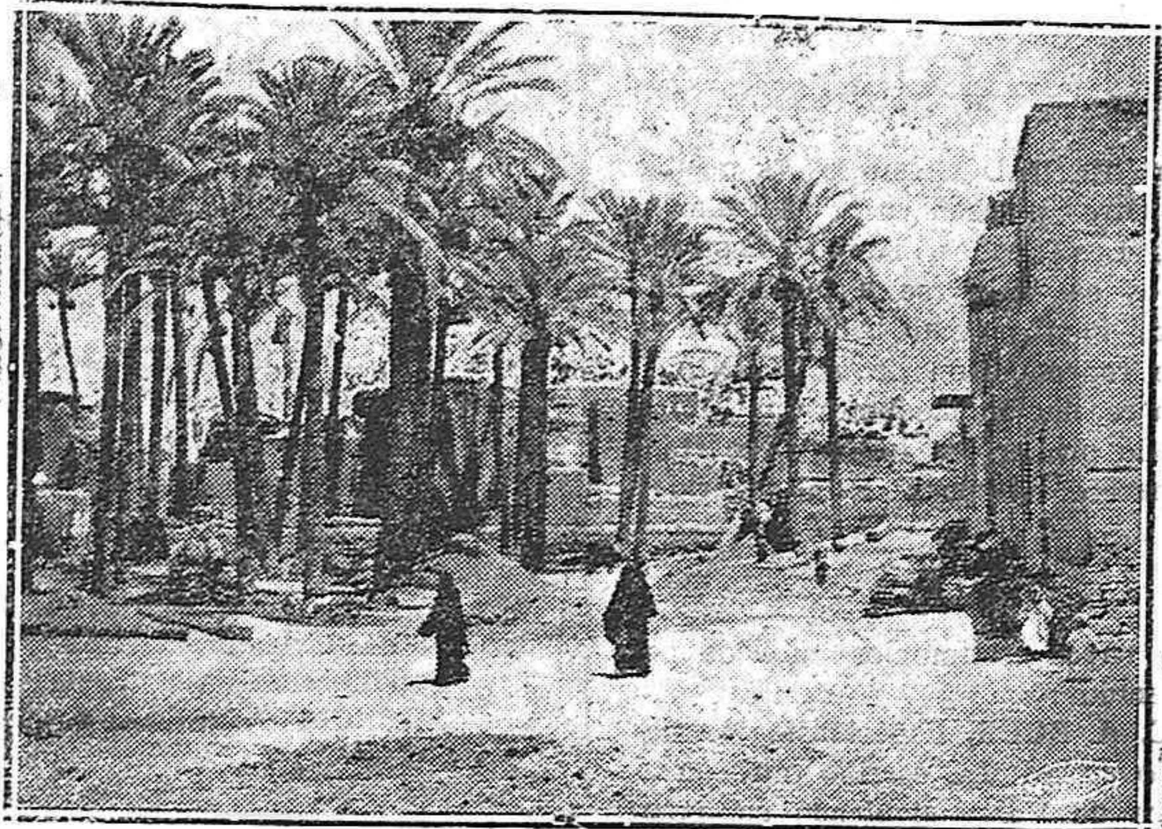
EN EL DESIERTO DE NUBIA.—Oasis de Vadrachin. (Foto del andarín Arturo Winterfield, enviada expreso para este periódico).