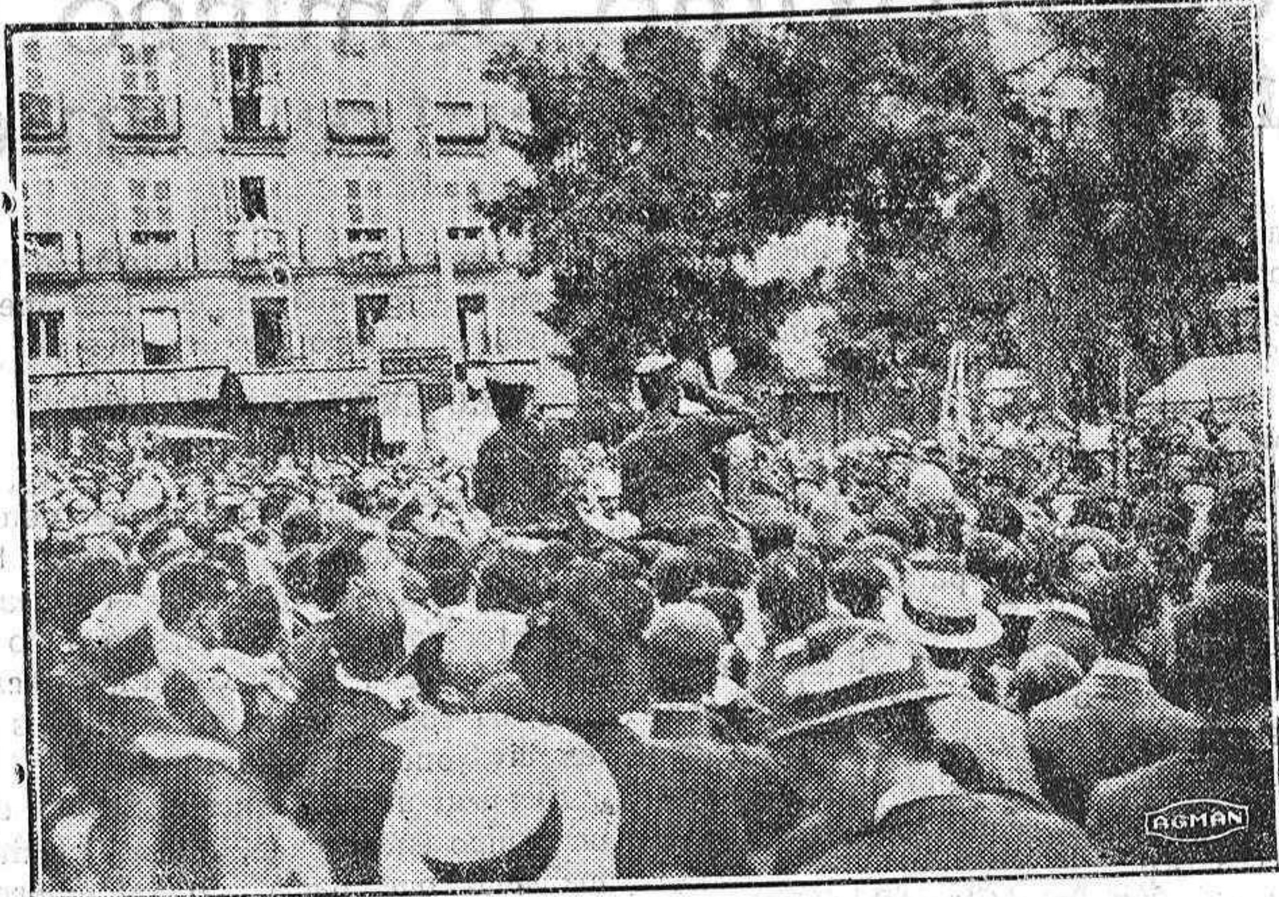
Una fotografía histórica.—Aspecto que ofrecían las calles de Madrid en la proclamación del Directorio.

Hace un llamamiento a los hombres de ciencia y a los de toga, por muy radicales que sean, para que apoyen