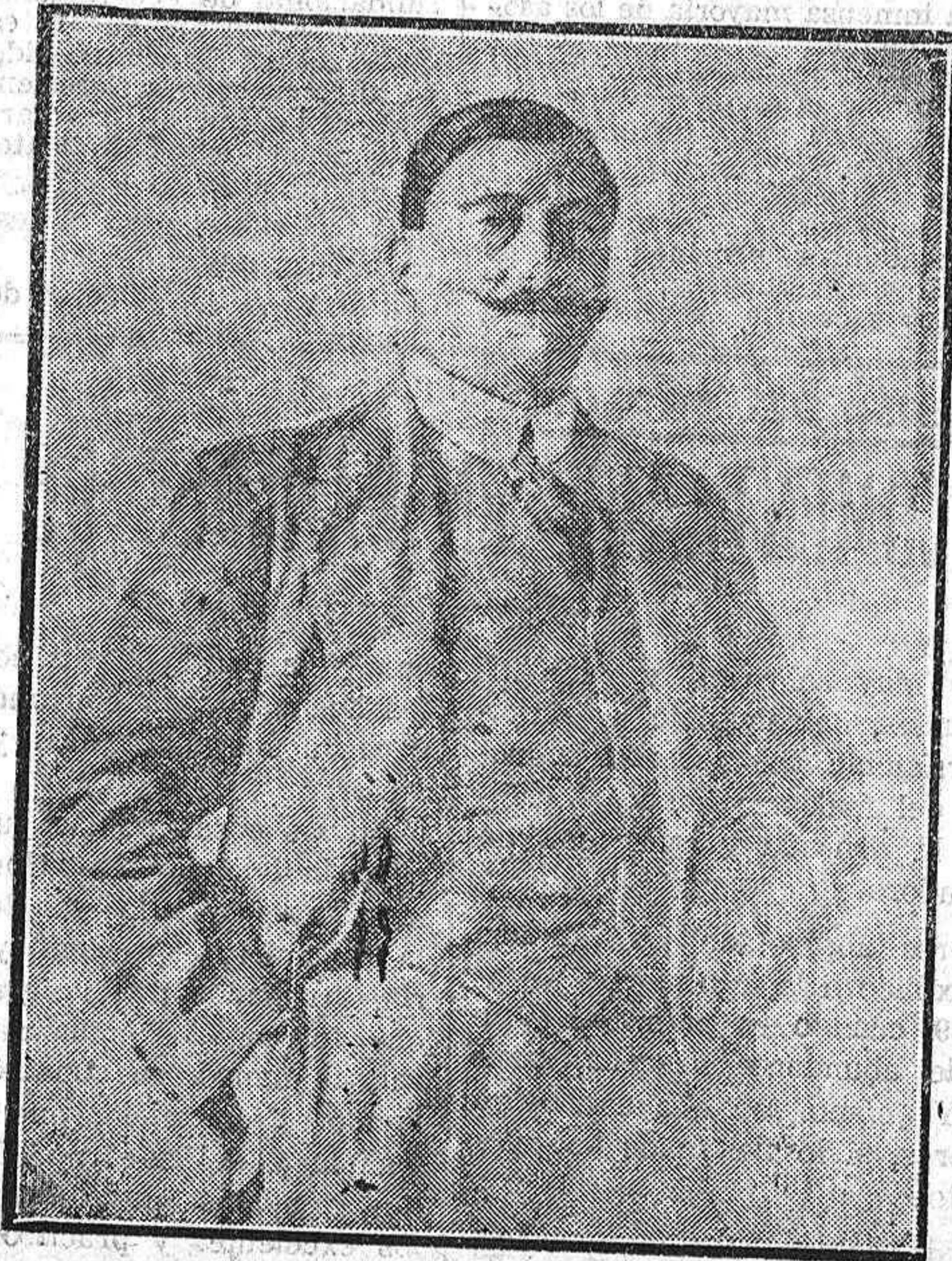
El general don Dámaso Berenguer, conde de Xauen, a quien el Rey ha dado el encargo de formar Gobierno.

—Le conocí; pero no tuve apenas ocasión de tratarle. Fué ministro en situación liberal, y luego, durante el Gobierno conservador en que yo era ministro de Hacienda, desempeñaba él la Alta Comisaría en Marruecos, pero por mi cargo no tenía contacto con él.