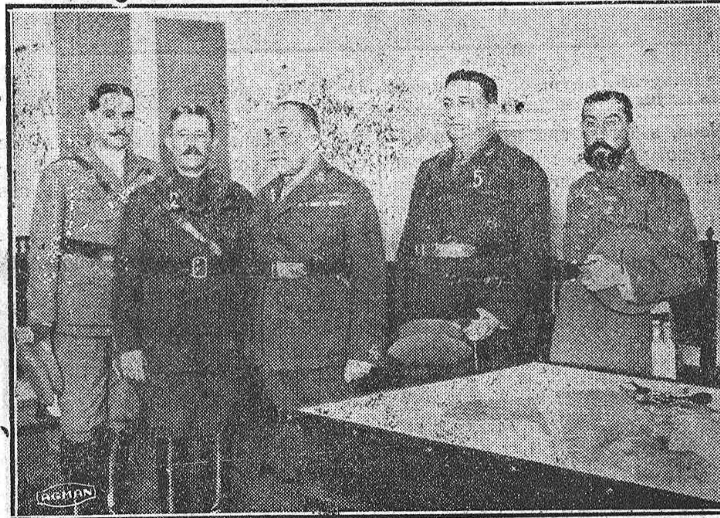
Una fotografía histórica.—El Directorio militar en el momento de su constitución.—El Capitán general de Castilla la Nueva (1), con los generales Cavalcani (2), Saro (3), Dabán (4), y Berenguer (D. Federico) (5).

La nota de despedida del presidente dice: «El rey ha admitido mi dimisión, y la de los ministros, teniendo para todos frases de la mayor benevolencia y elogio, ordenando que se haga saber a todos sus deseos, así como a los funcionarios y a las corporaciones, de que sigan desempeñando todos sus cargos y funciones hasta que se cons-