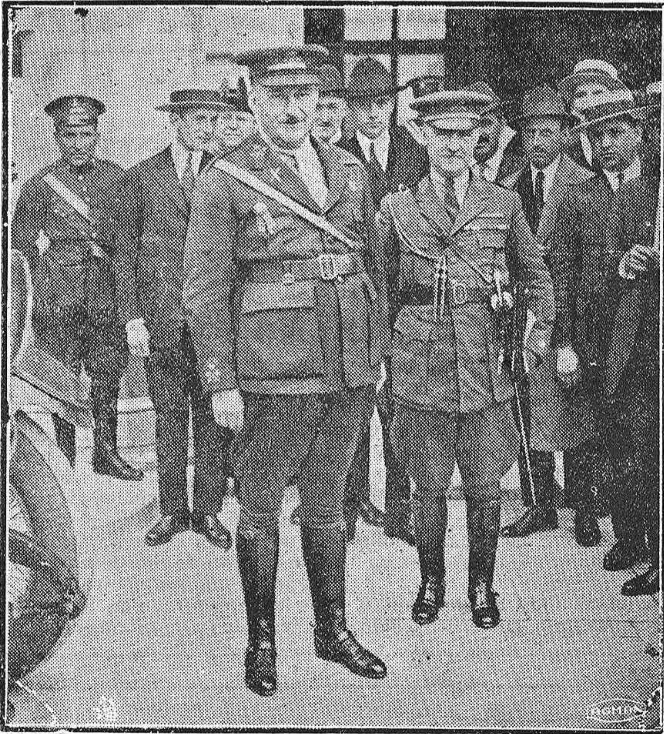
Una fotografía histórica.—El Marqués de Estella saliendo de Palacio, después de jurar el cargo de Presidente del Directorio, en septiembre de 1923

—Creo que mañana a las doce podrá decirles algo interesante. Ahora