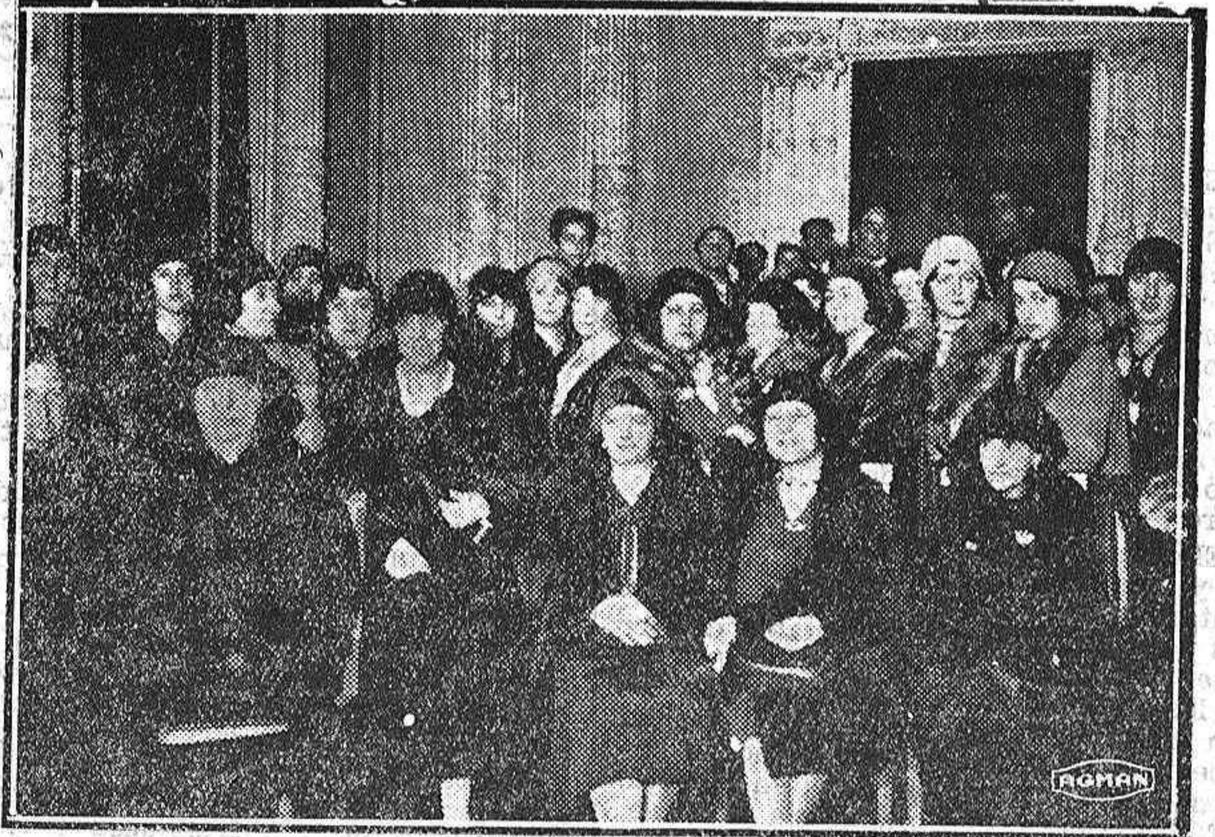
Un grupo de hermosas damas y lindas señoritas que asistieron a la Asamblea de la Cruz Roja en la tarde del domingo.

mas actividades y les desea mil triunfos en el nuevo año de su vida social. Se le aplaude con viva simpatía, y los aplausos saludan a Su Ilustrísima, que resume el acto con paternales frases de felicitación a toda la Junta,