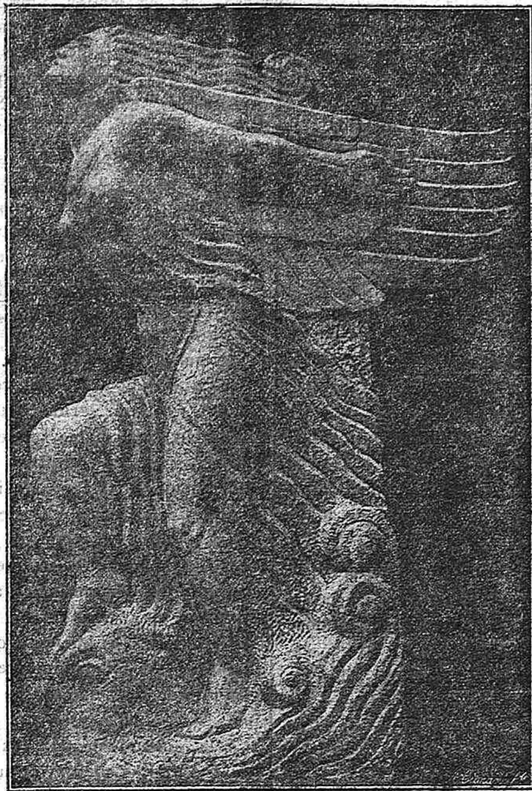
«Victoria», del monumento a Elcano, obra del insigne escultor palentino Victorio Macho, que se ha inaugurado en la villa de Guetaria.

Los artículos que publica este periódico están escritos expresamente para EL DIARIO