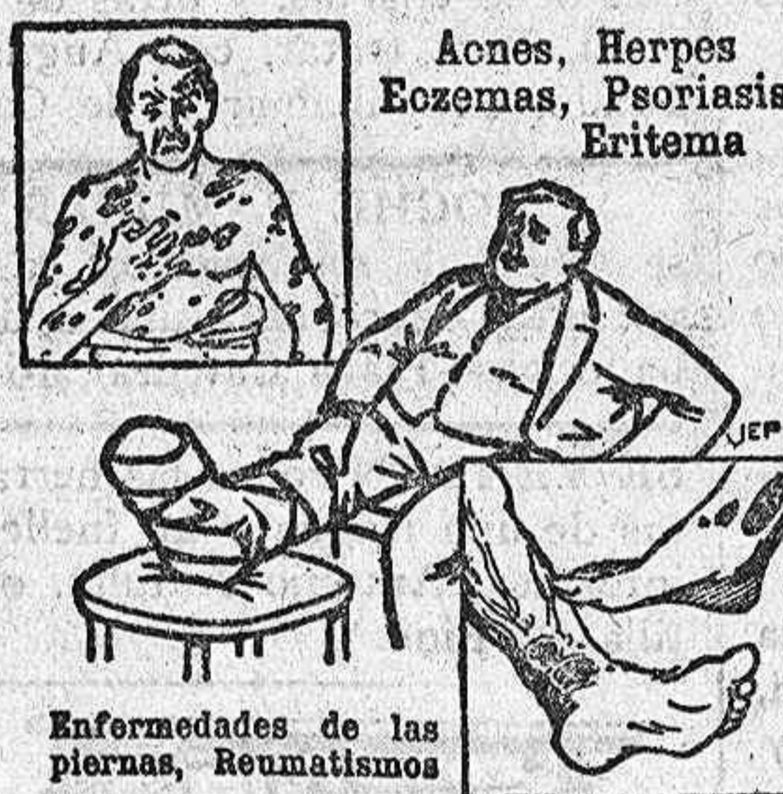
Enfermedades de las piernas, Reumatismos