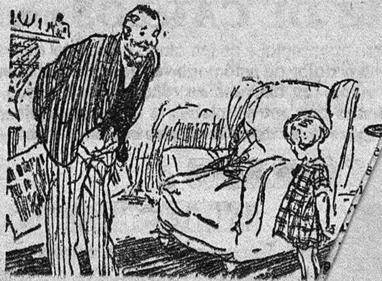
El huésped.—Buenos días, preciosa, ¿Has pasado la pequeña.—No sé. He dormido todo el día.