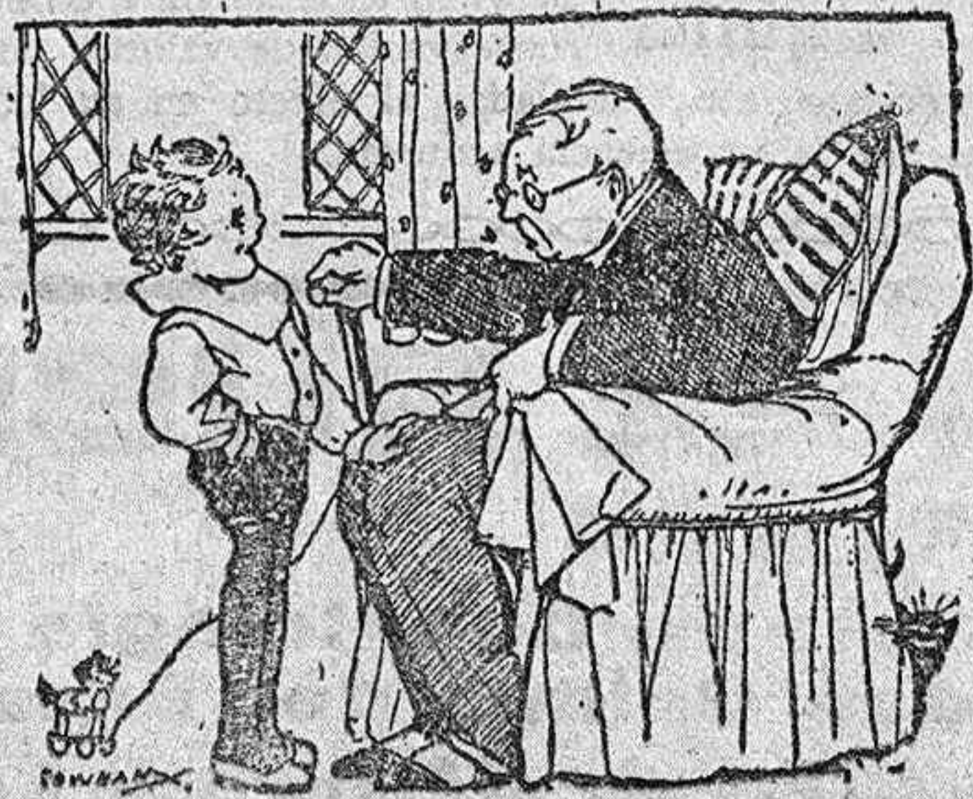
—¿De gustaria ser un objeto como usted, sin otras ocupaciones que pasar las horas sentado en una silla preguntando estúpidamente—