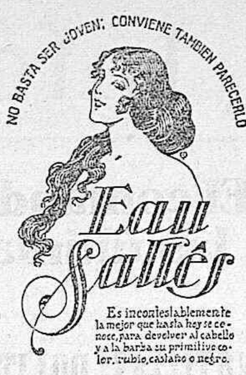
EXIGIR LA MARCA: EMILE SALLÉS FILS