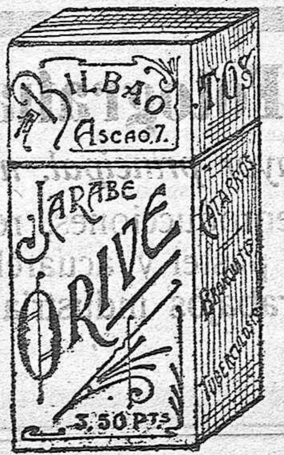
El Jarabe Orive es de grato sabor y de acción sorprendente en todas las afecciones del aparato respiratorio.