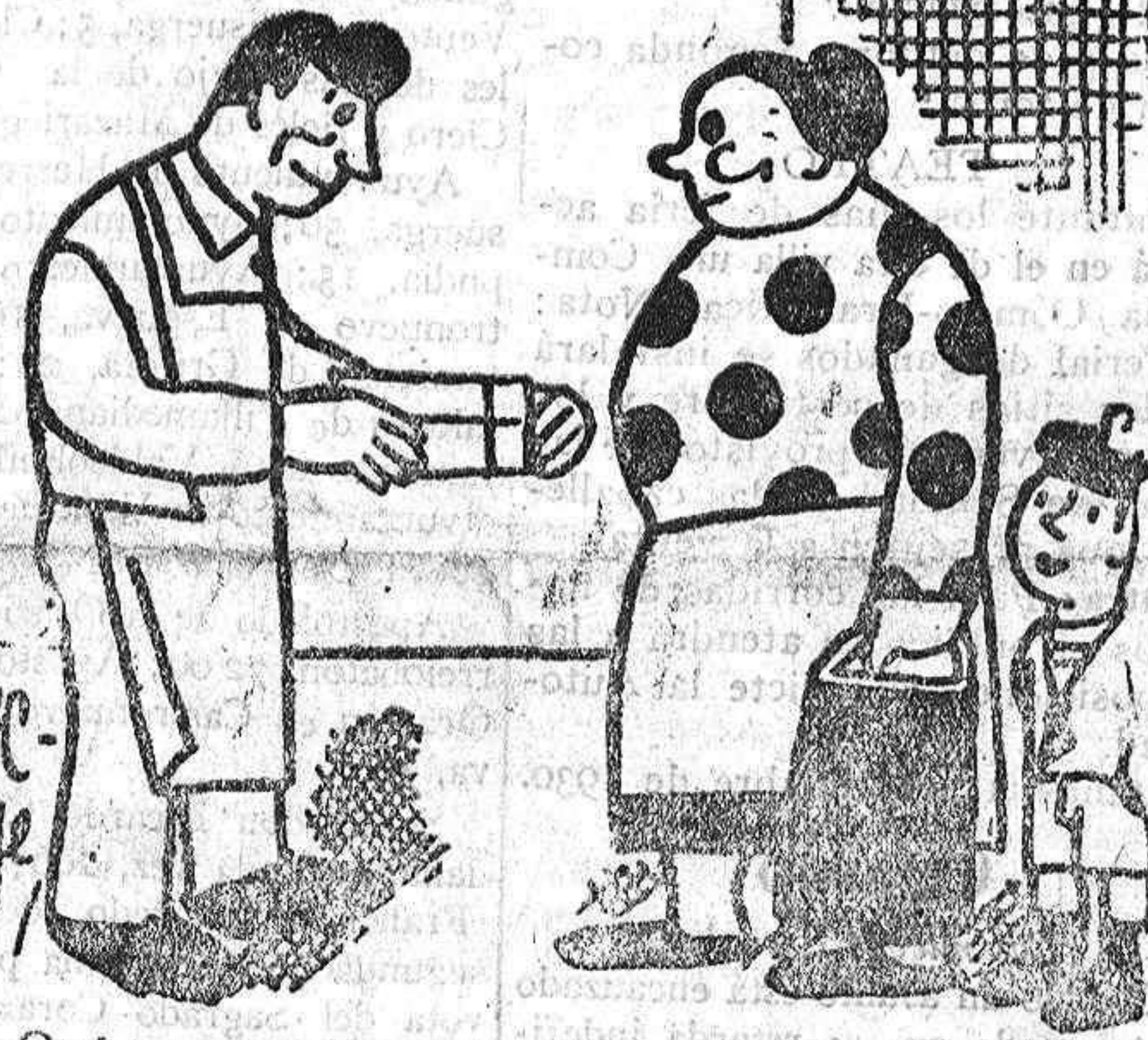
—Qué caro vende usted el kilo del azúcar. El almacén de la otra esquina lo vende más barato que usted. —Sí, pero aquí los terrones son más grandes!