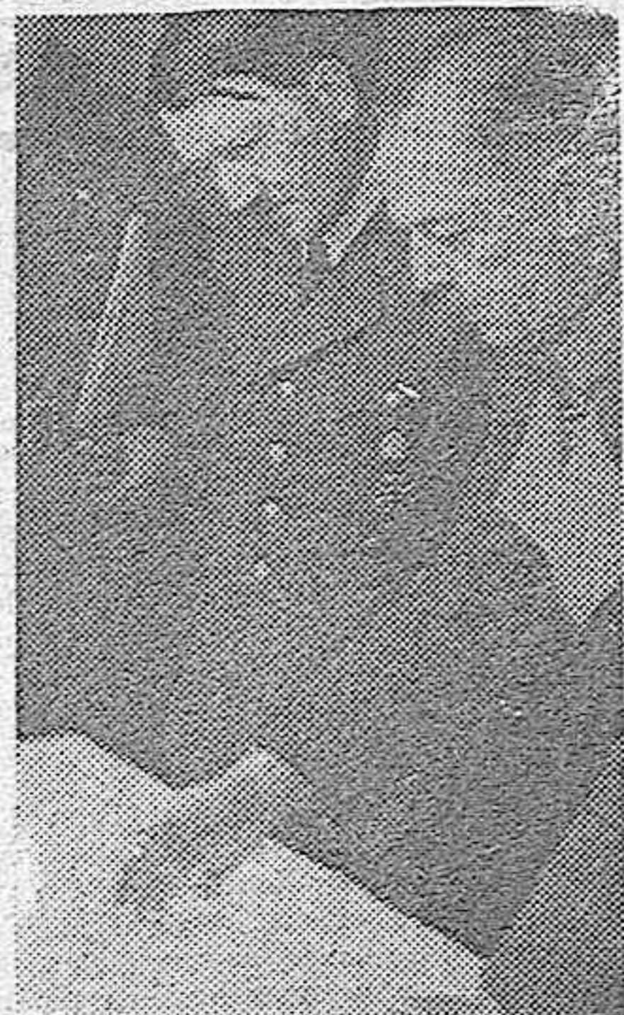
El Führer y jefe supremo de los Ejércitos alemanes, con el jefe de su Estado Mayor, general Keitel, y el general von Rundstedt, examina sobre el plano la marcha de las operaciones.