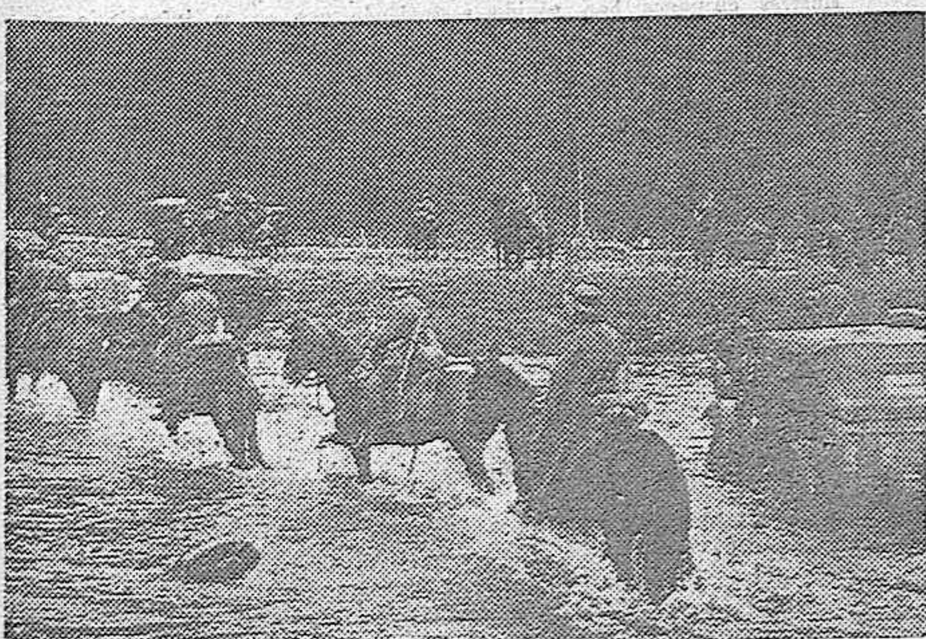
Las tropas alemanas vadean un río durante su avance por Bélgica.

Con motivo de la festividad religiosa del día de hoy, mañana no aparecerá EL DIA DE VALENCIA