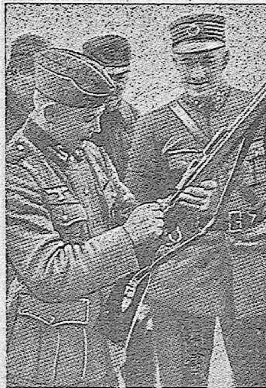
Un soldado alemán explicando a otro noruego el manejo de su fusil.

QUINTO.—Ampliación del plazo de duración de los poderes especiales ya conocidos.