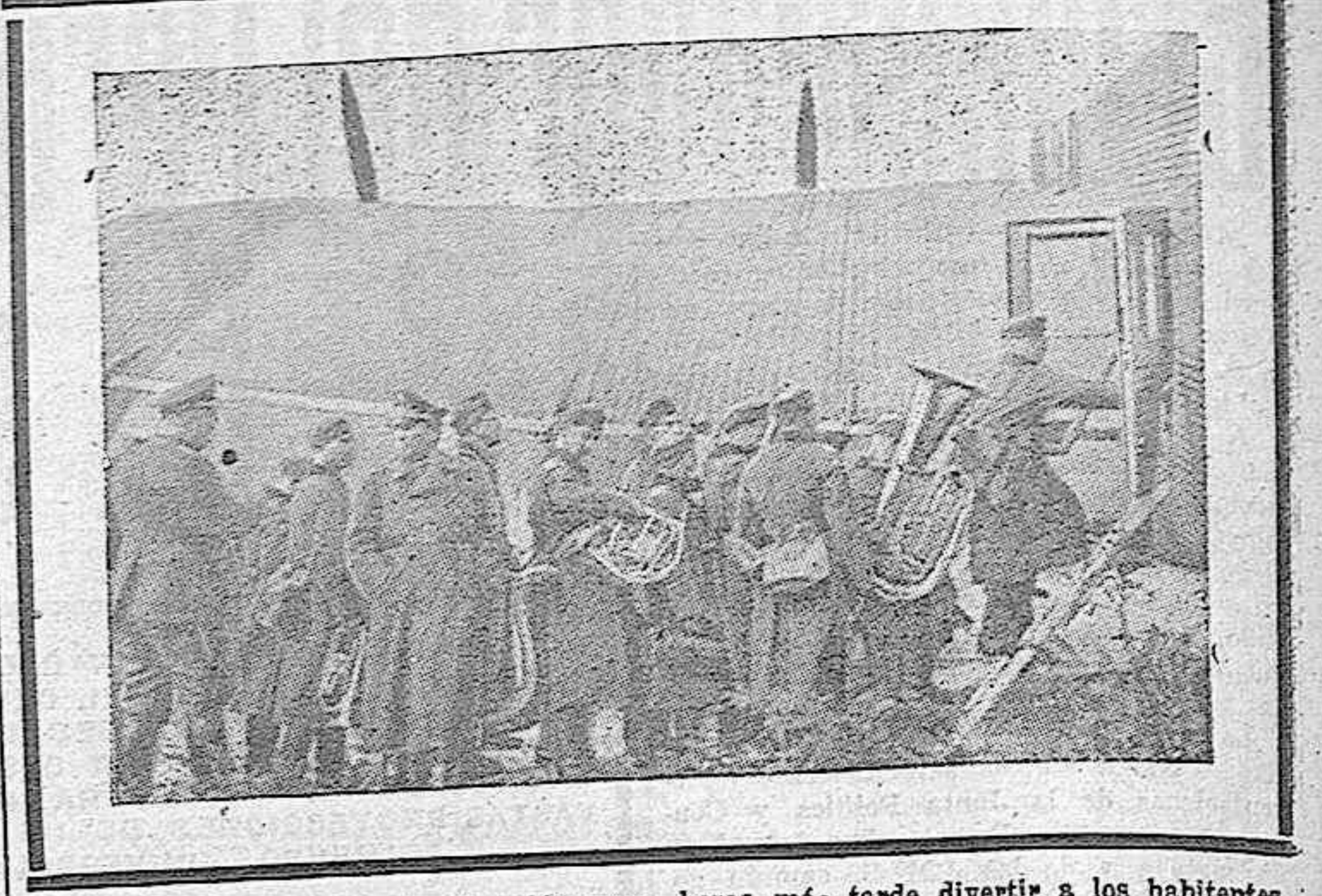
Músicos alemanes tomando el avión para horas más tarde divertir a los habitantes de Oslo.