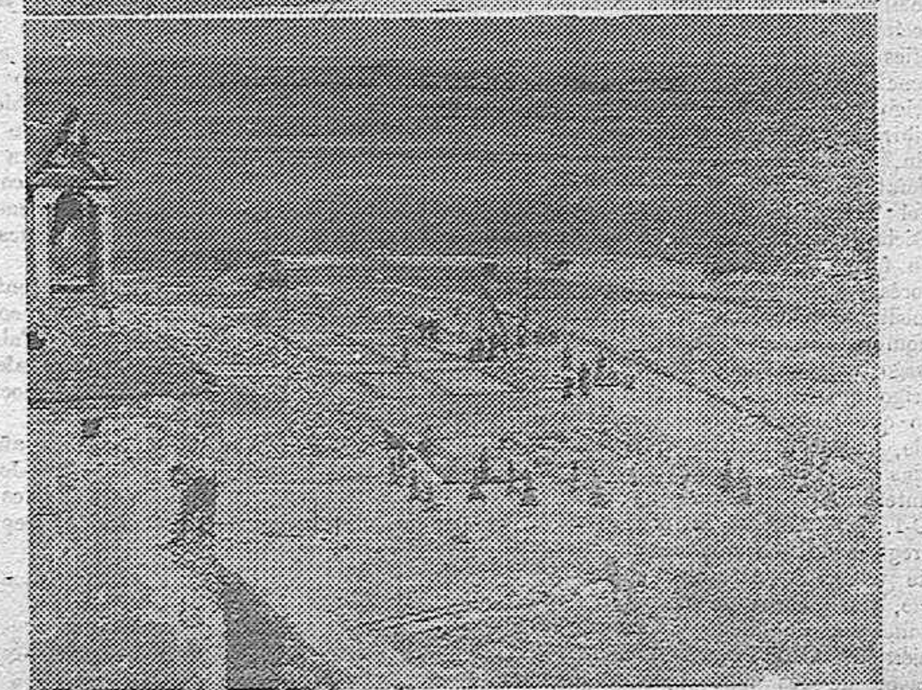
Han quedado inauguradas las obras de reconstrucción de Brunete, localidad adoptada por el Caudillo. El ministro de la Gobernación, señor Gerardo Suárez, a quien acompaña el director general de Regiones Devastadas, se dirige al pueblo para colocar la primera piedra del grupo de 800 viviendas para labradores. En el grabado inferior, un aspecto de las obras de cimentación.