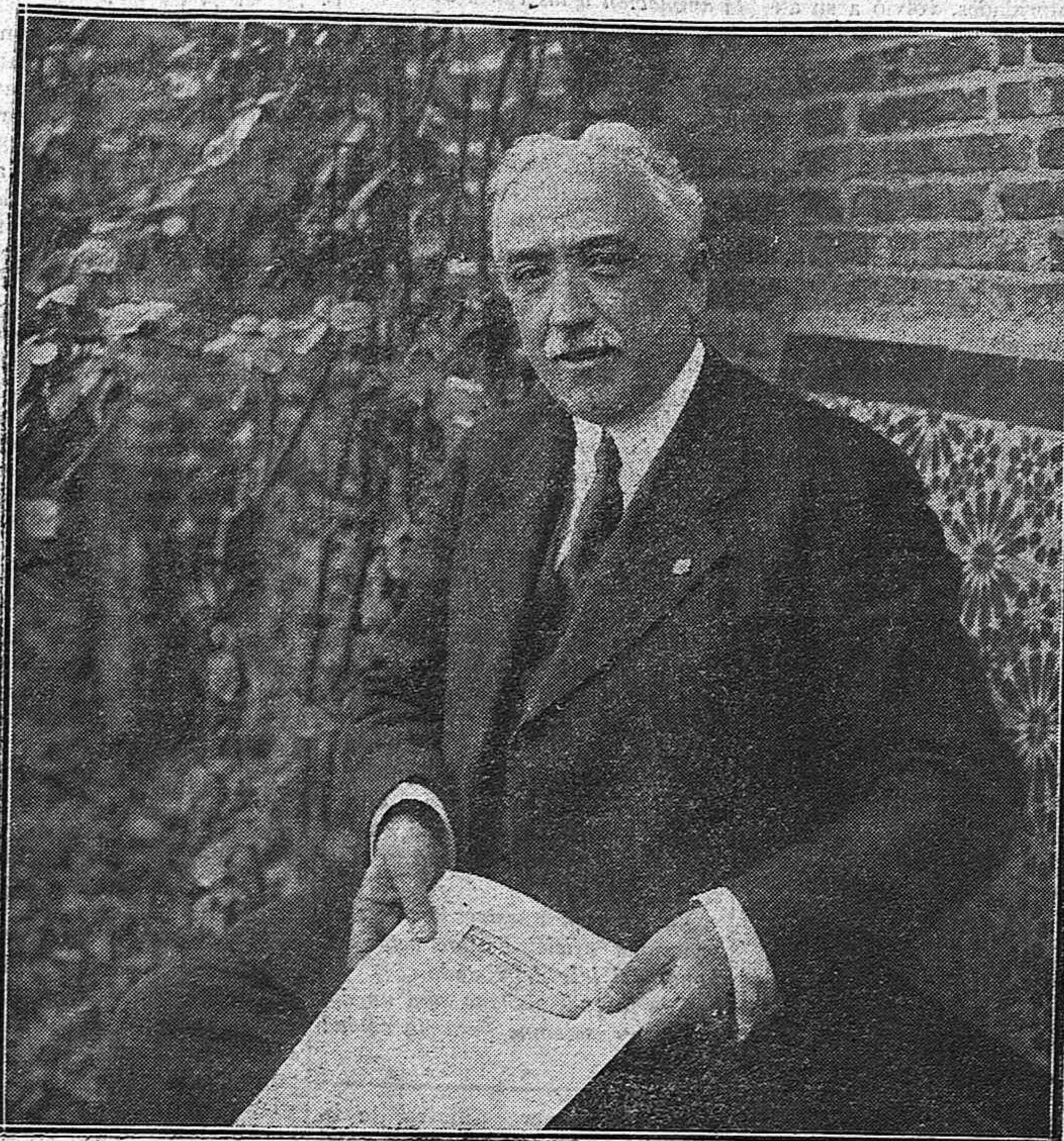
Su Excelencia el Presidente de la República española don Niceto Alcalá Zamora, la más alta representación del Estado, que llegará mañana a Palencia.